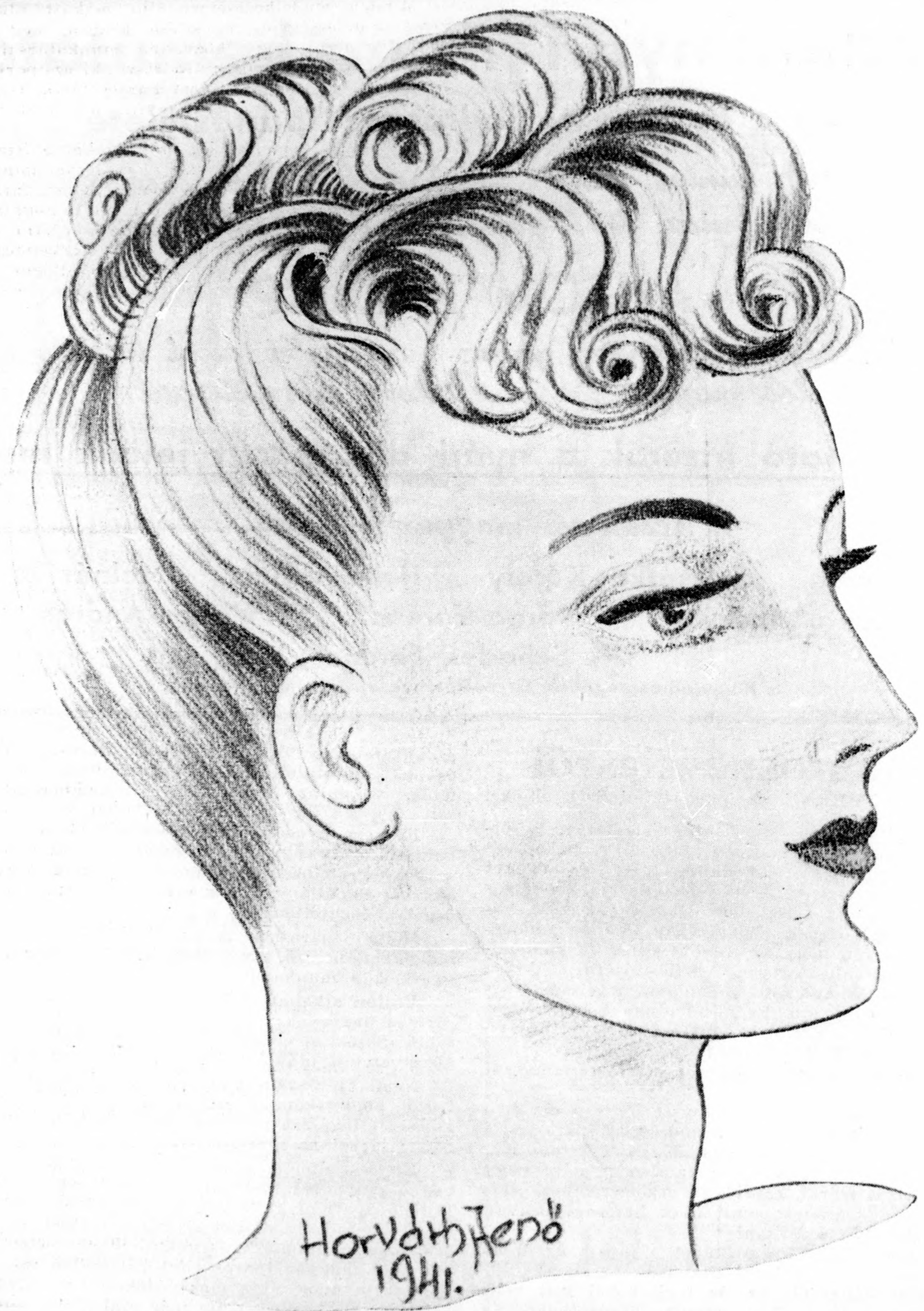
Modern strand és nyári frizura