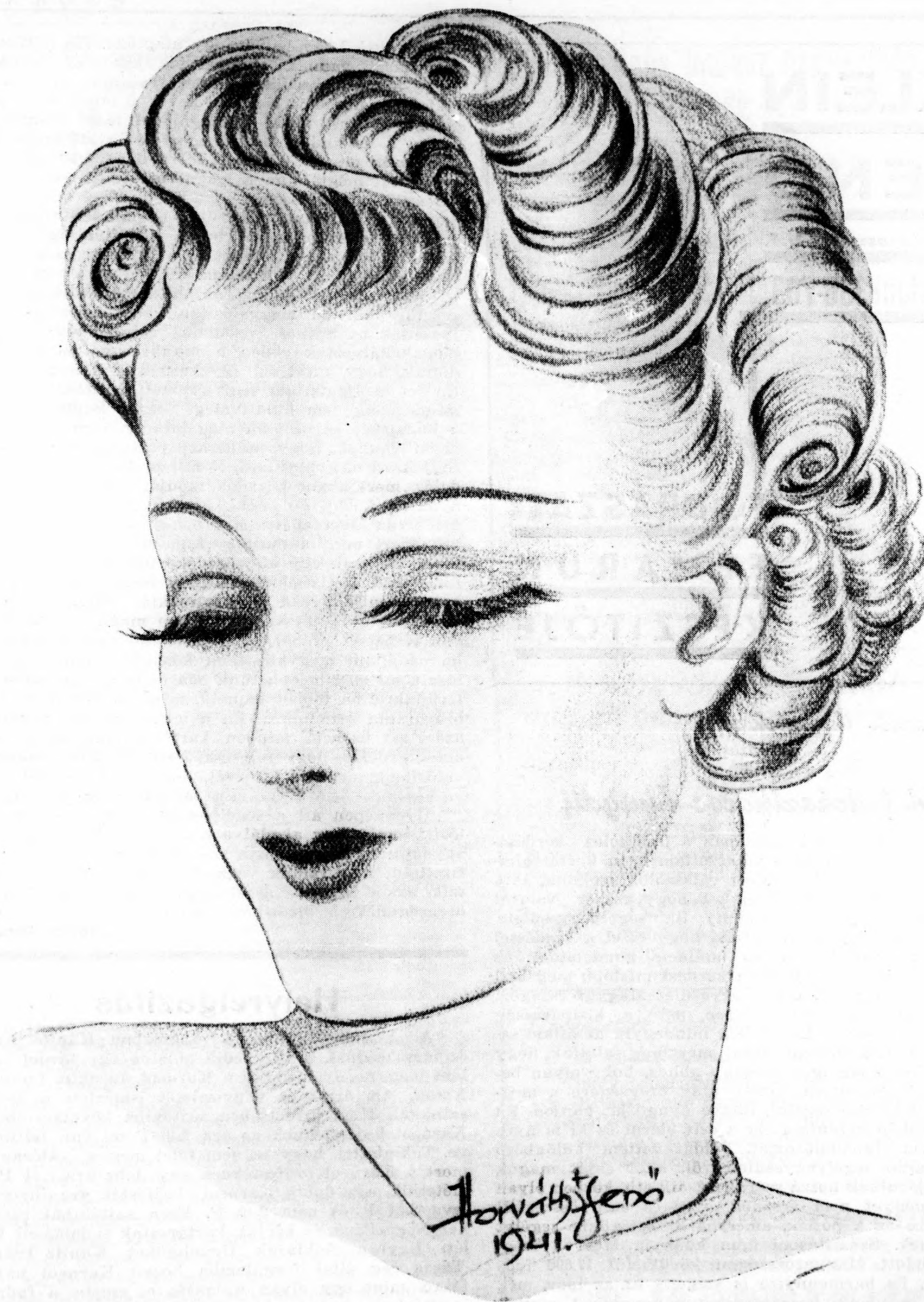
Modern strand és nyári divatfrizurák