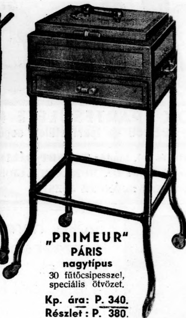
„PRIMEUR” PÁRIS nagy típus 30 fűtőcsipesszel, speciális ötvözet. Kp. ára: P. 340. Részlet: P. 380.