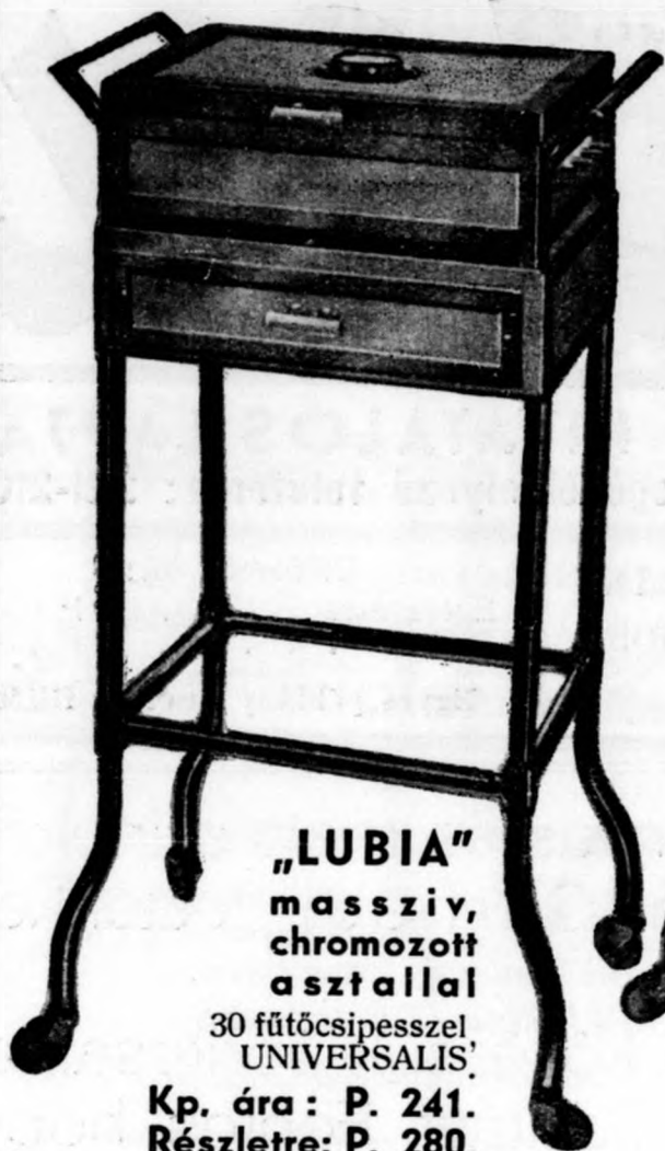
„LUBIA” masszív, chromozott asztallal 30 fűtőcsipesszel, UNIVERSÁLIS! Kp. ára: P. 241. Részletre: P. 280.

Tökéletes dauert előfűtéses géppel végezhet!