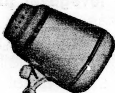
PRIMEUR PÁRIS FAVORIT