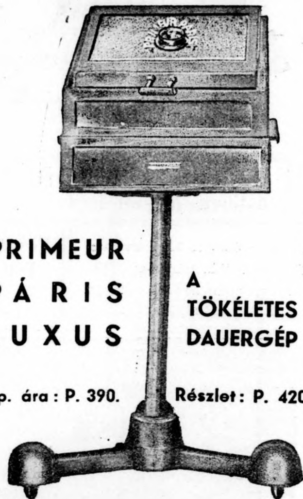
PRIMEUR PÁRIS LUXUS