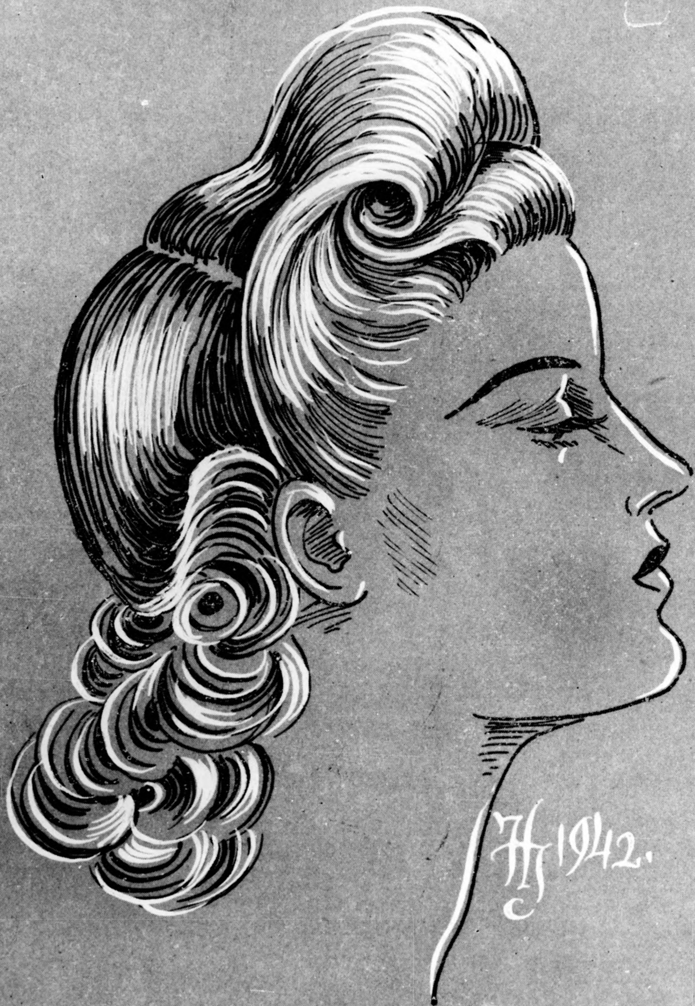
Új estélyi frizura