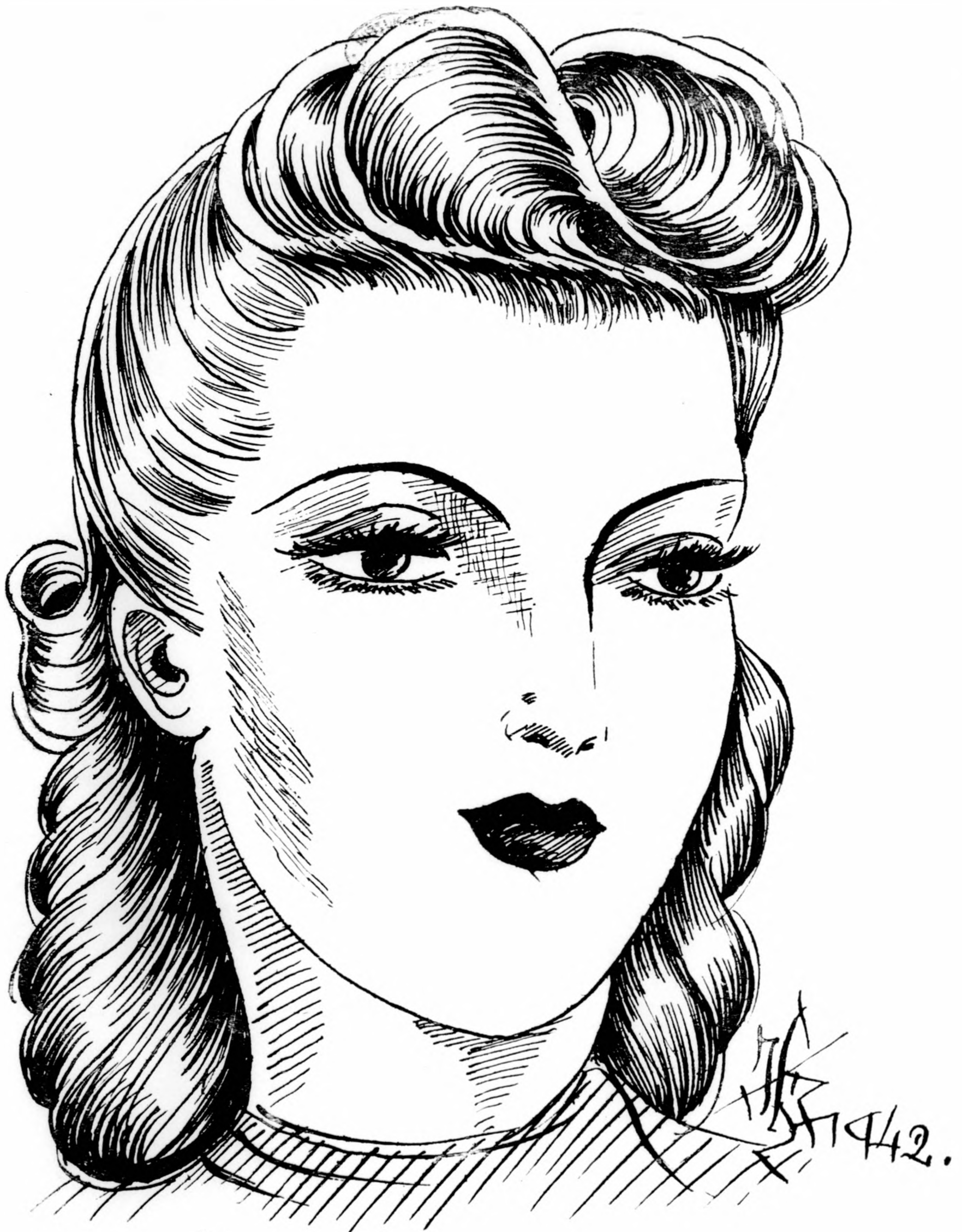
Új délutáni frizúra forma.