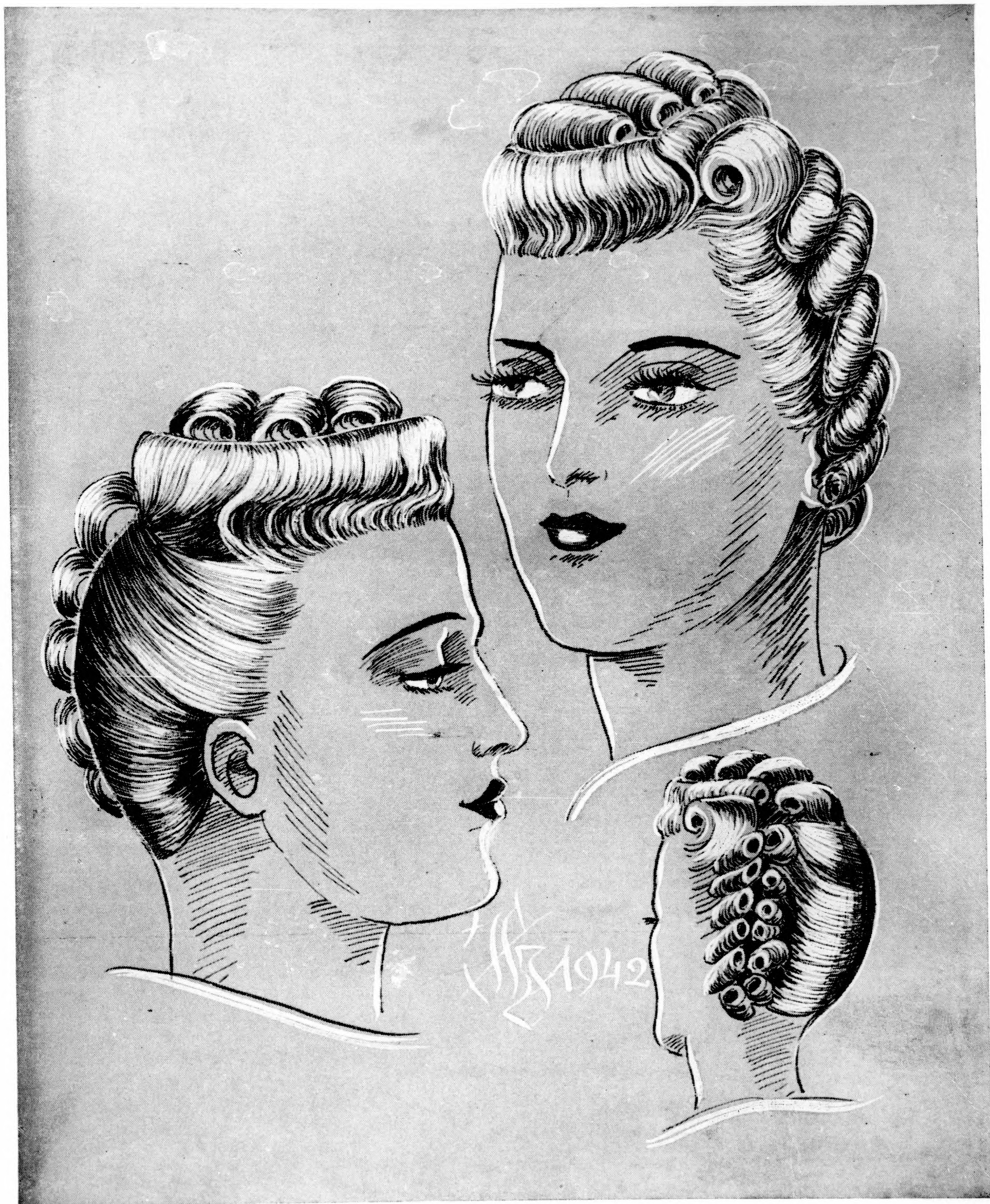
Különleges új forma feizurák