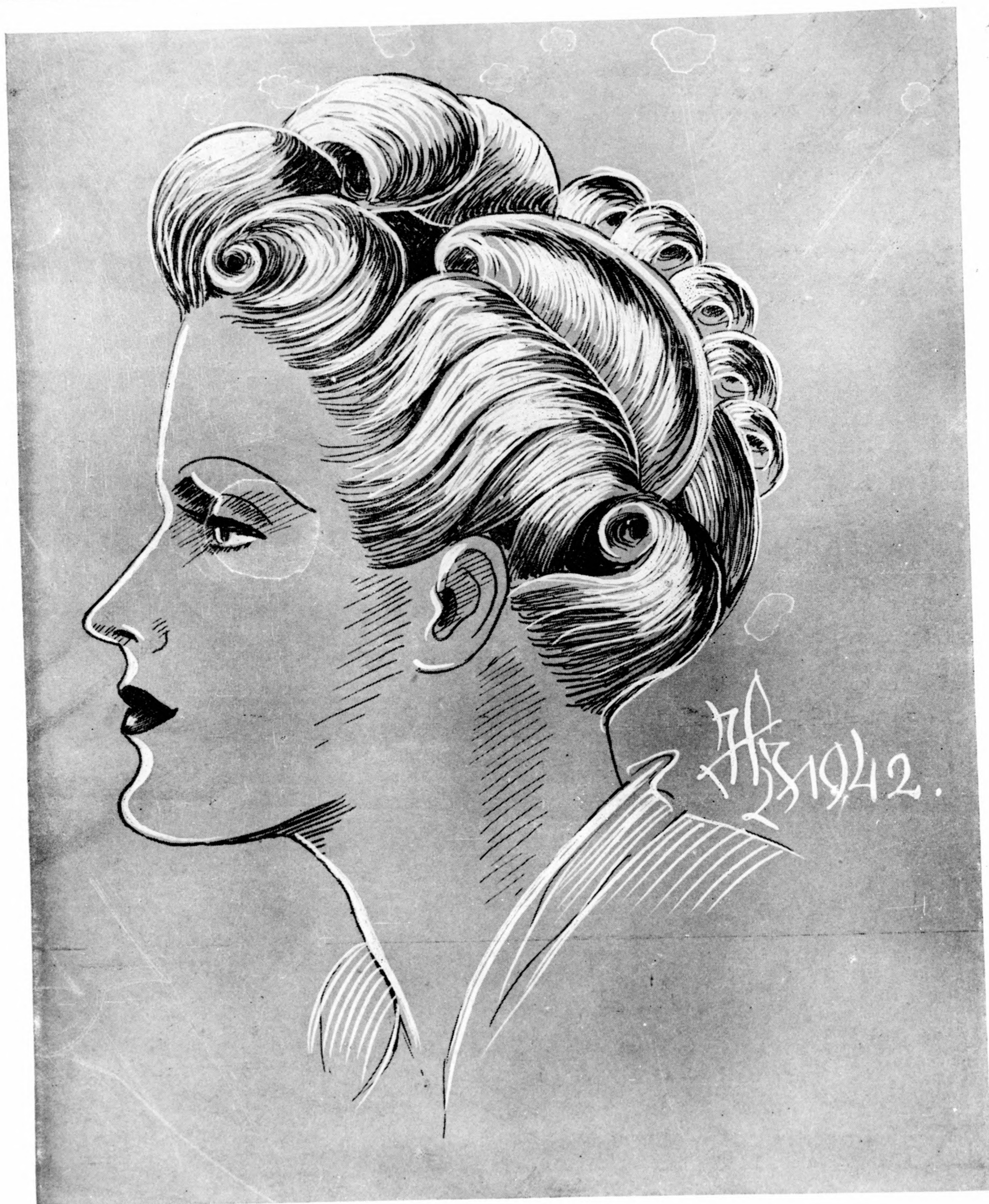
Nagy estélyi feizura.