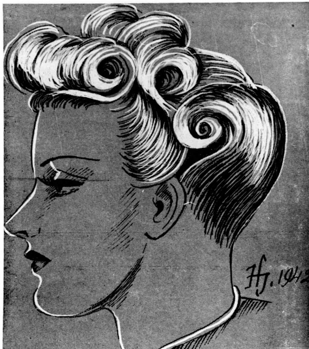
Magas nagylokni frizura