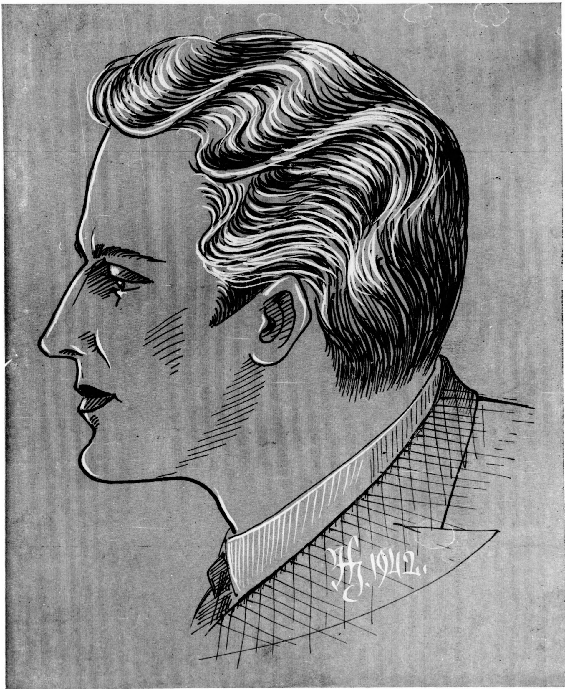
Modern nyári férfi hajvágás és frizura.