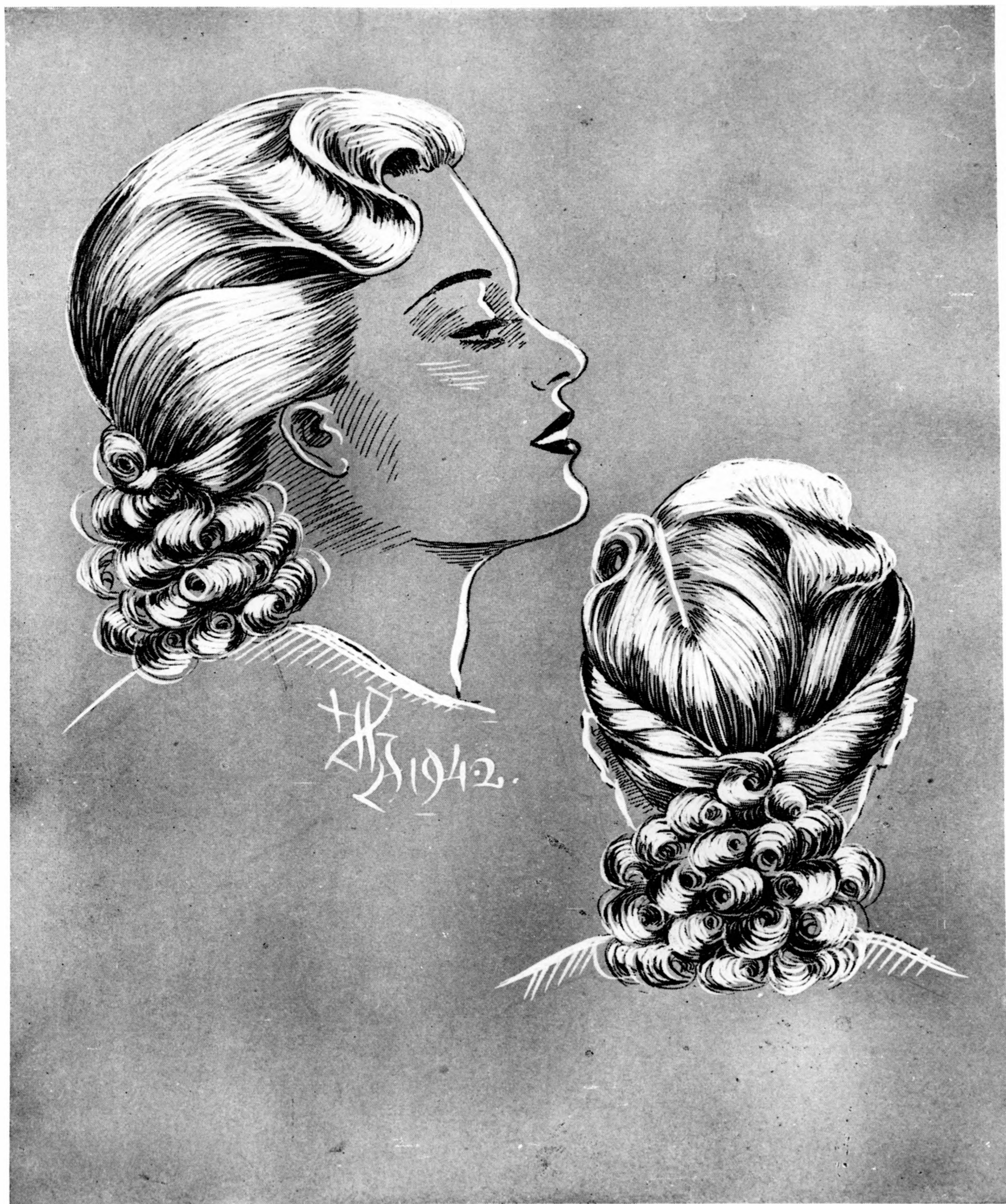
Különleges új frizura formák.