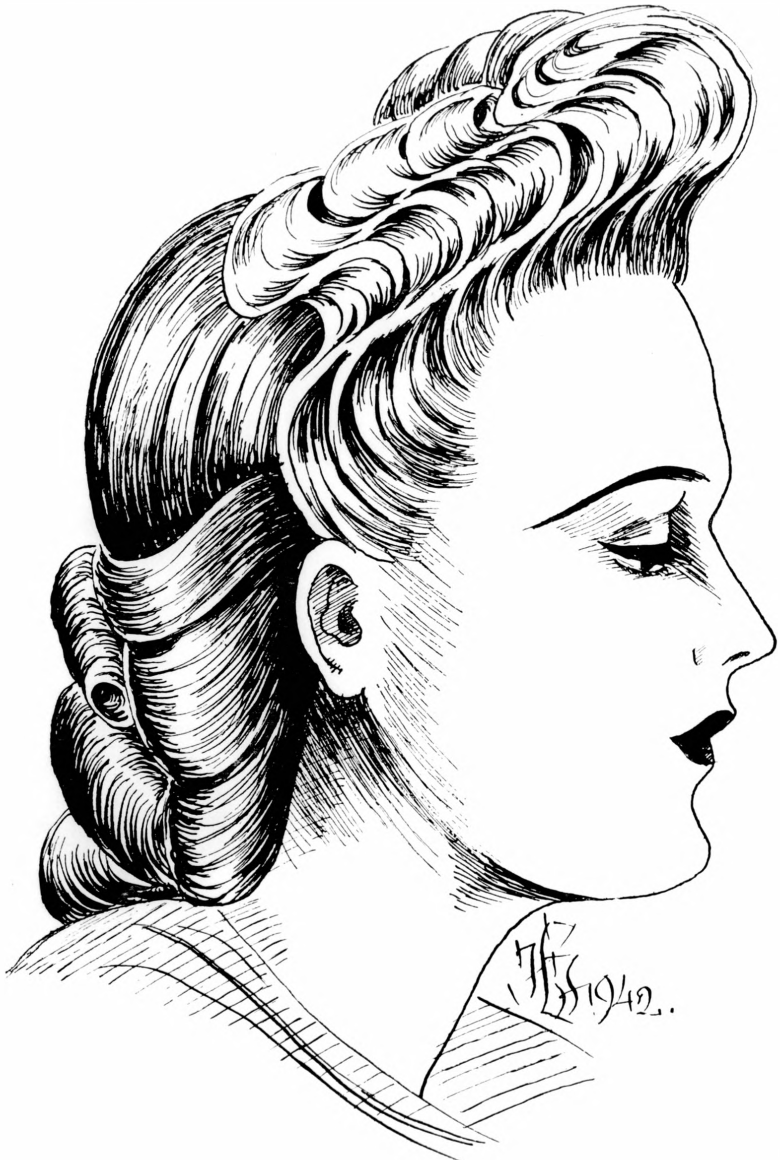
Modern őszi frizura fiatal hölgyek részére.