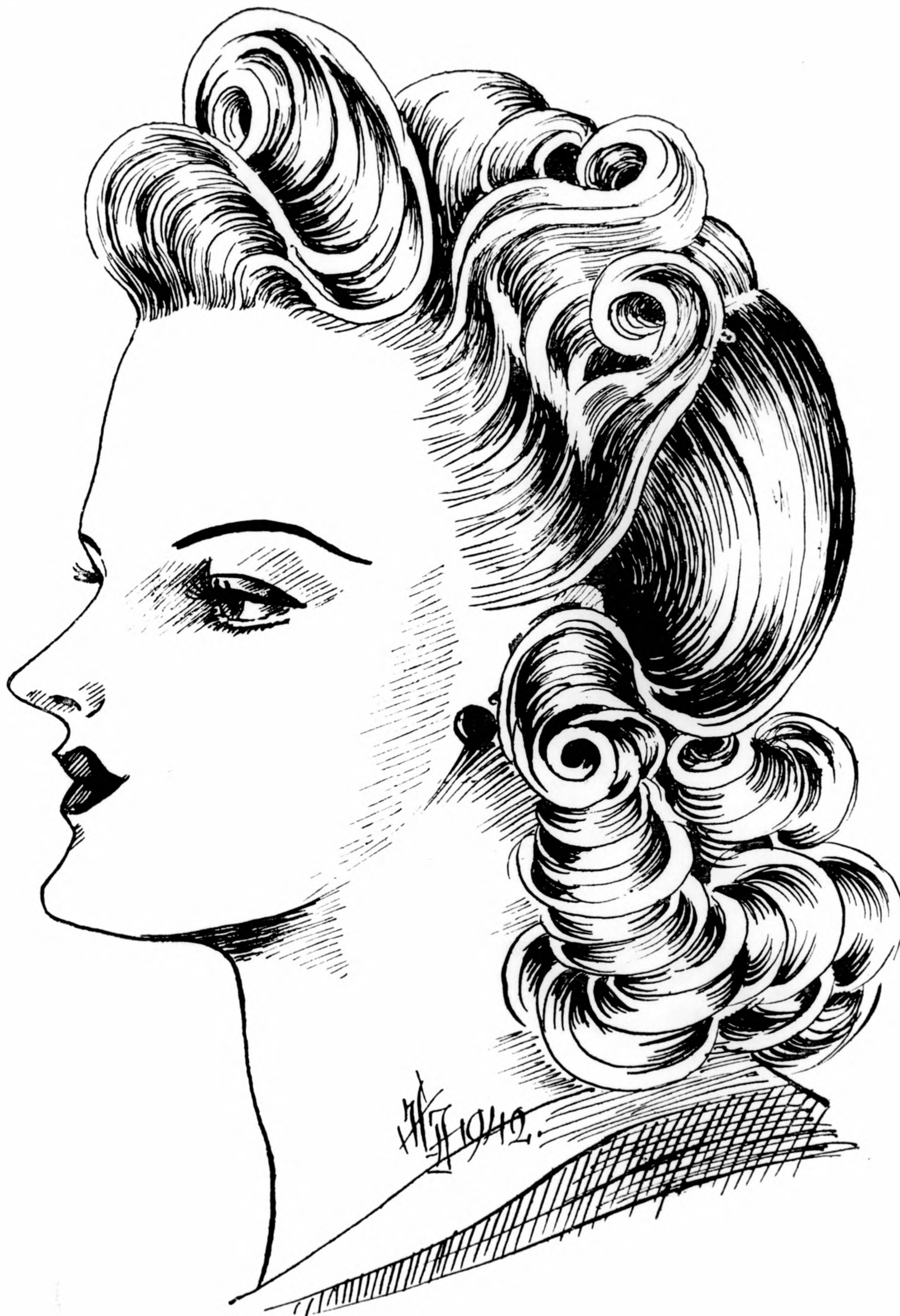
Modern őszi feizura.