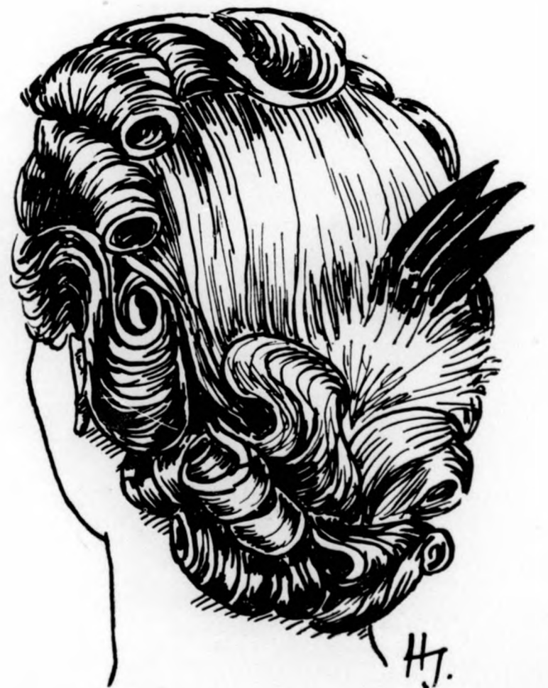
Új modern frizurák