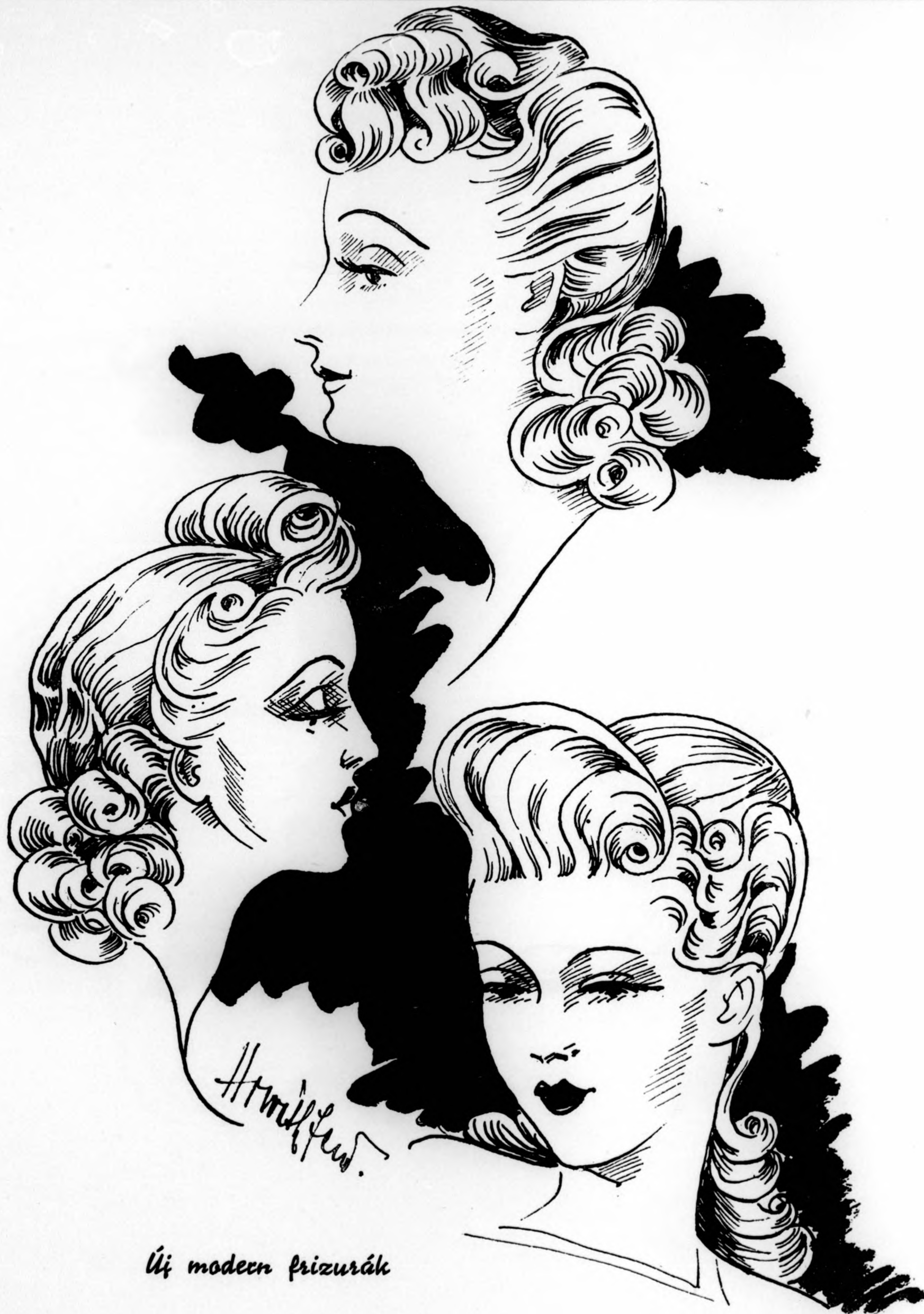
Új modern frizurák