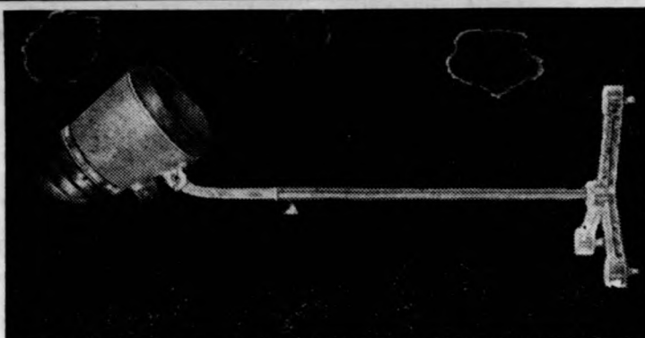
II. számú szárító BURA