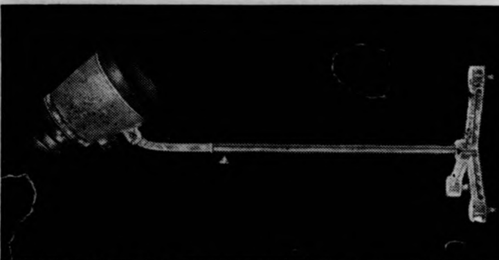
II. számú szűrítő BURA