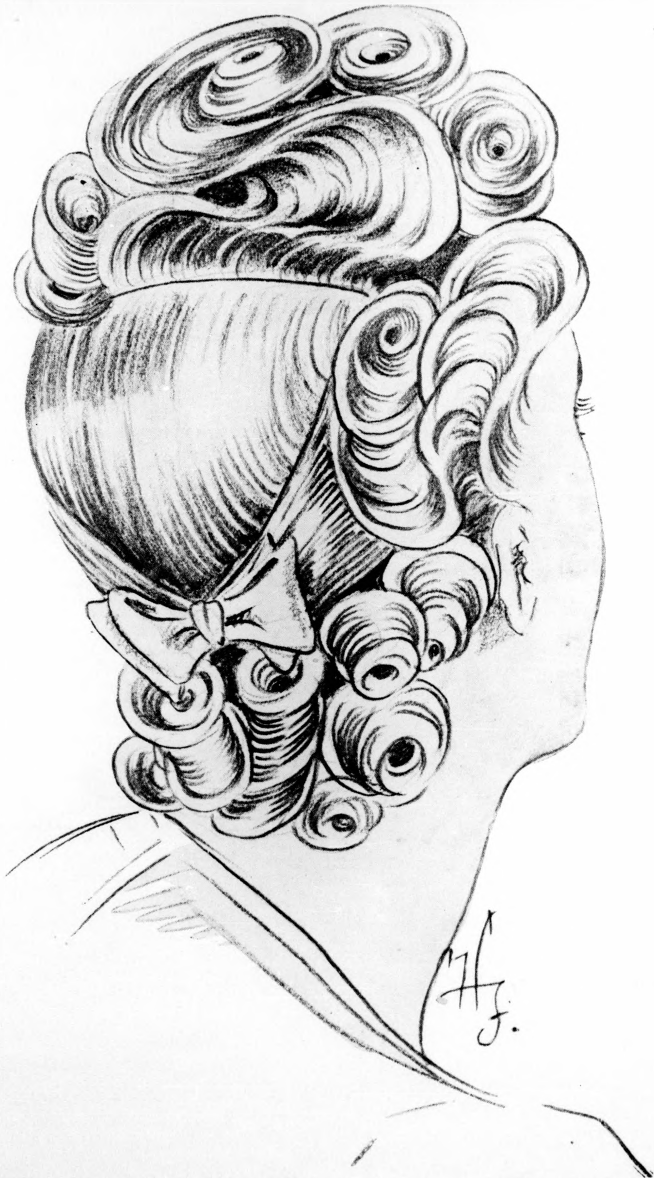
Modern nyári estélyi frizúra