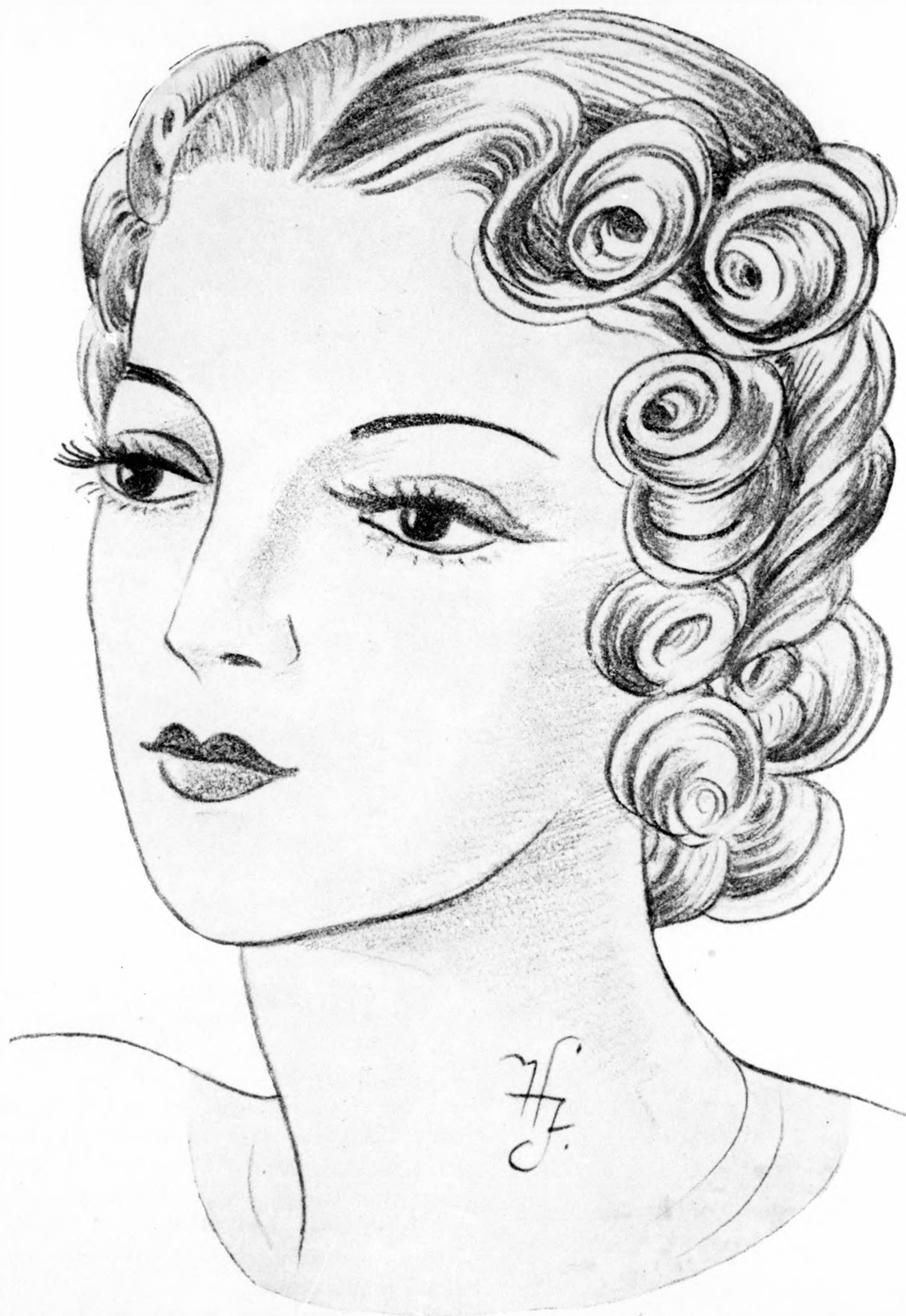
Különleges nyári frizura formák