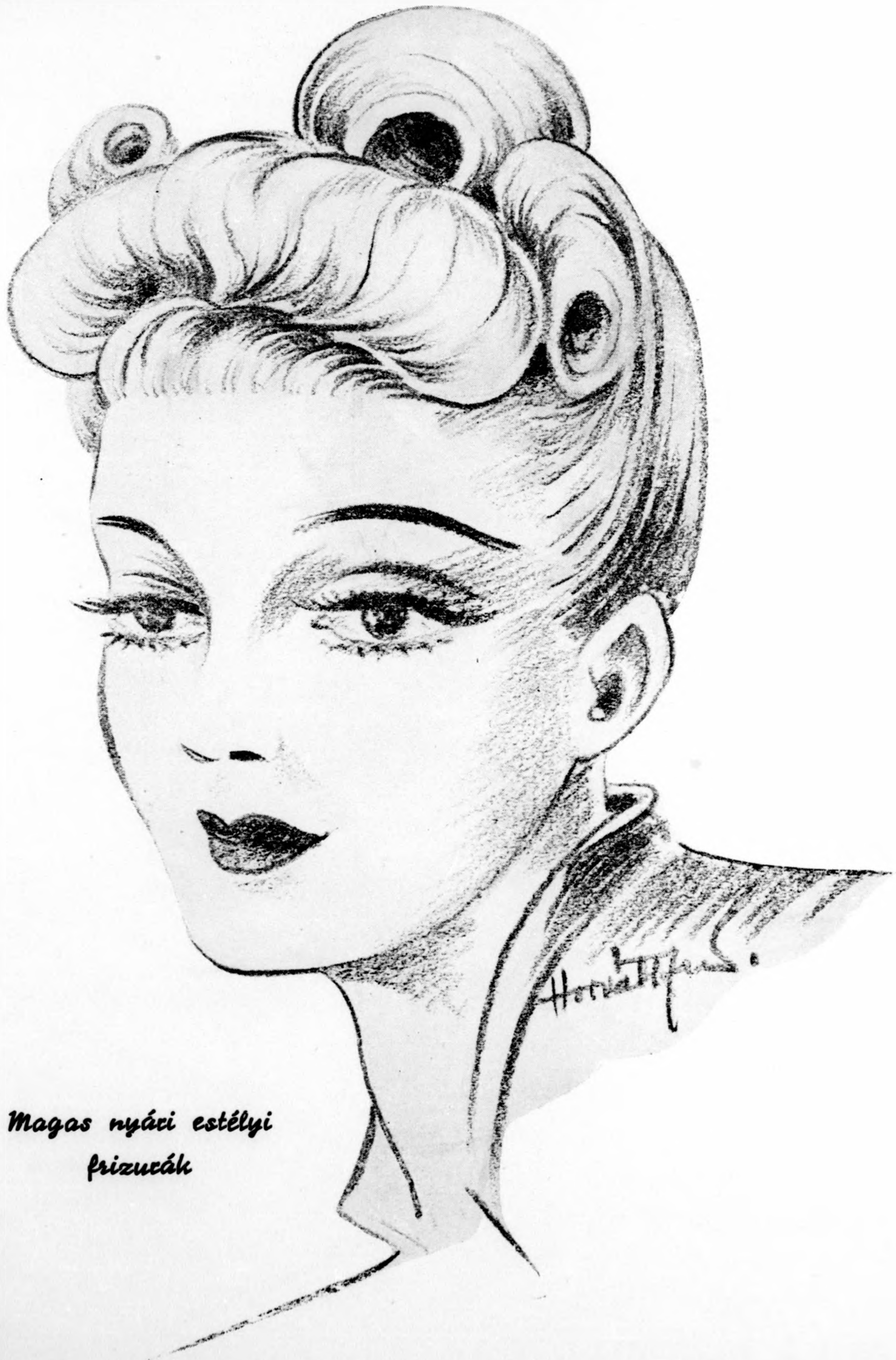
Magas nyári estélyi frizurák