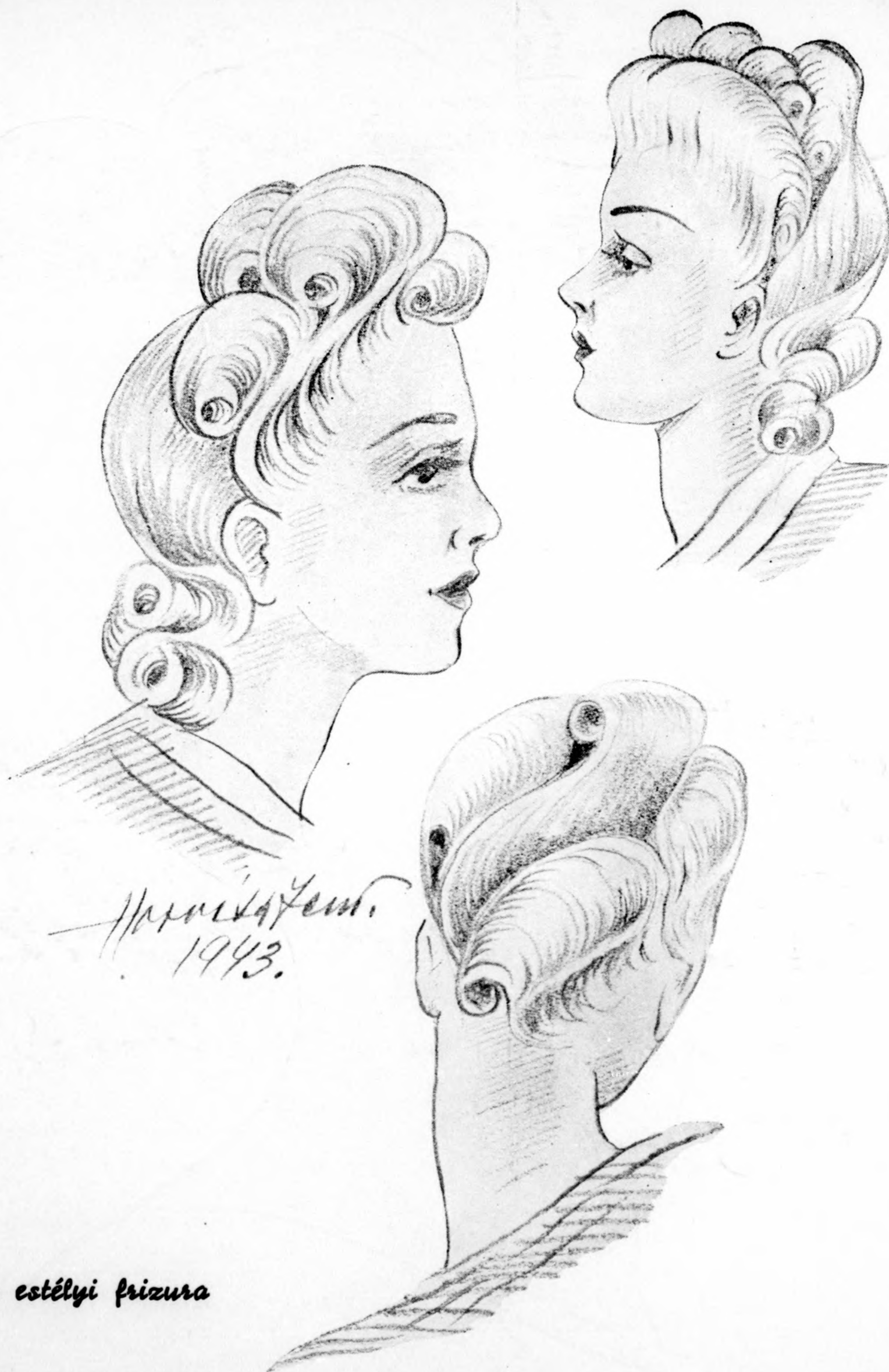
Modern estélyi frizura