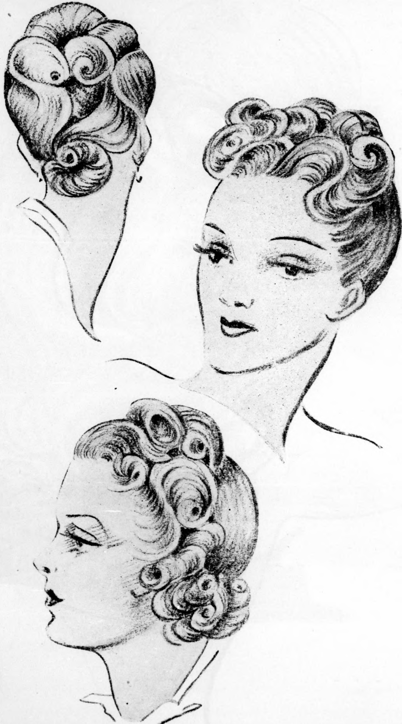
Modern délutáni frizurák