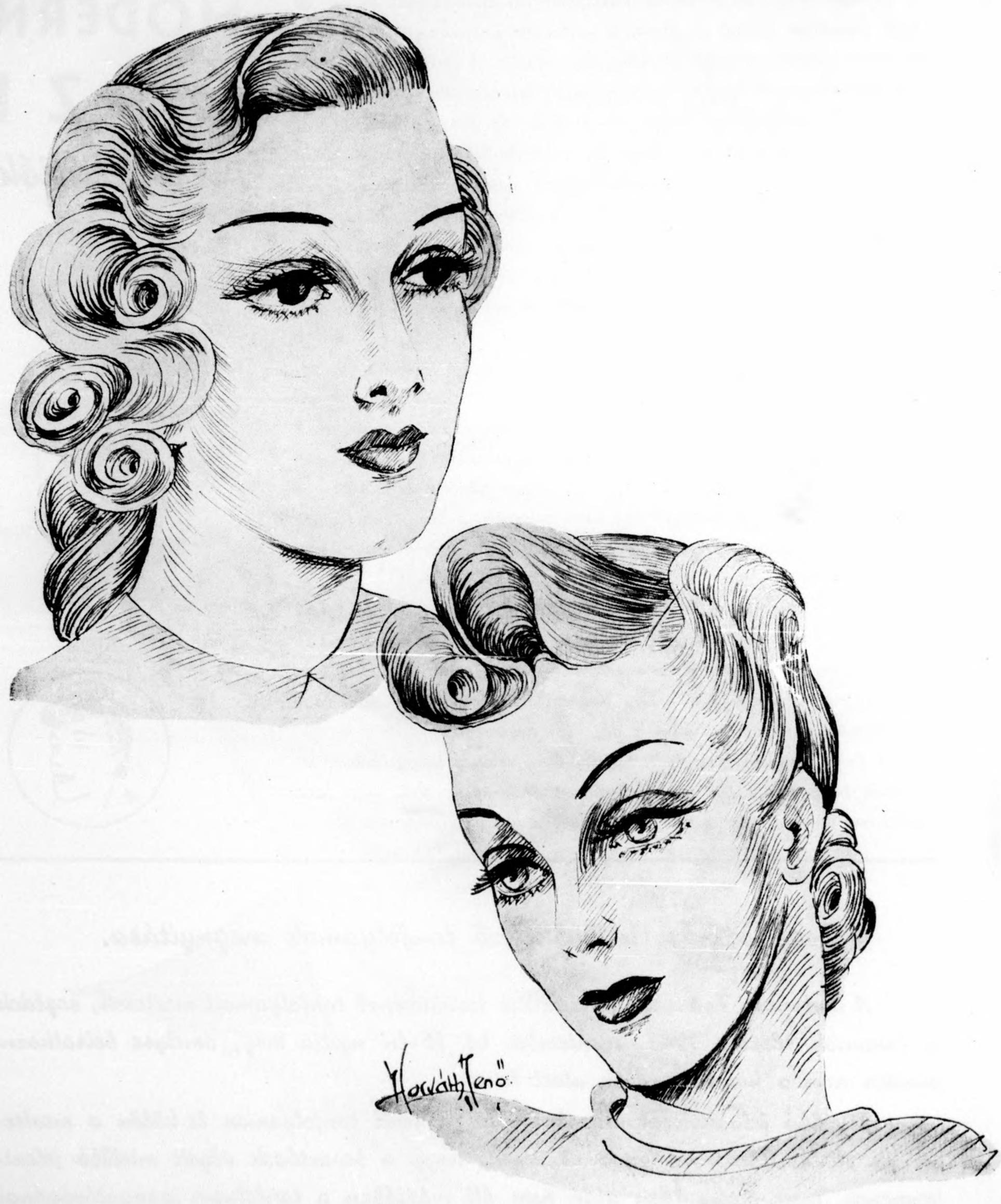
Modern őszi frizurák különleges formái