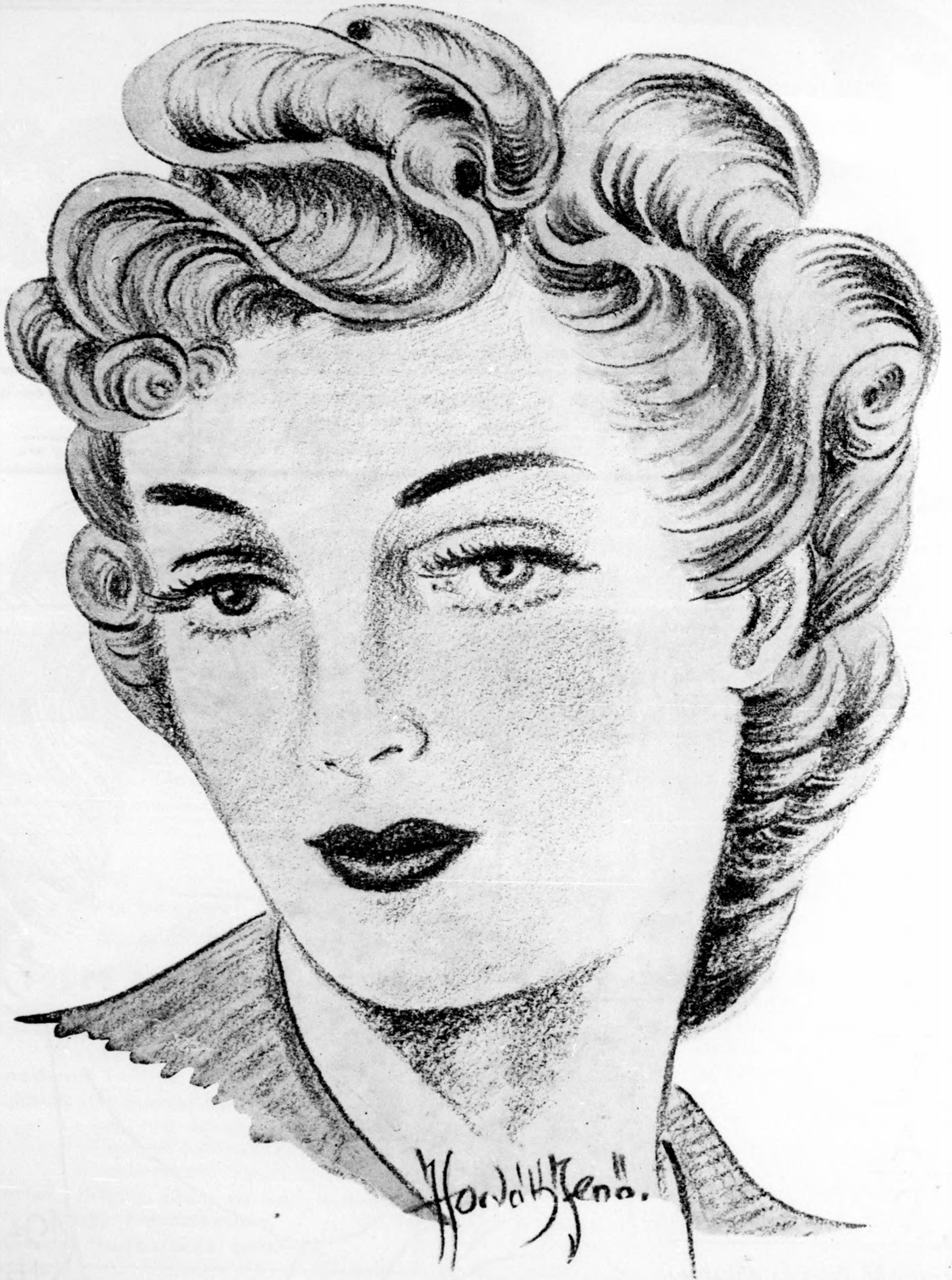
Modern őszi feizuca