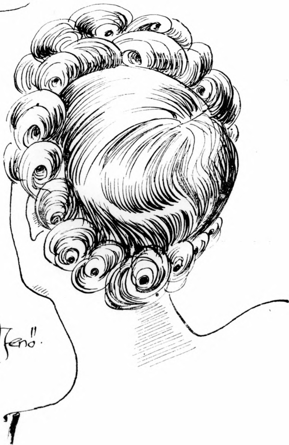
Legújabb frizura divatforma