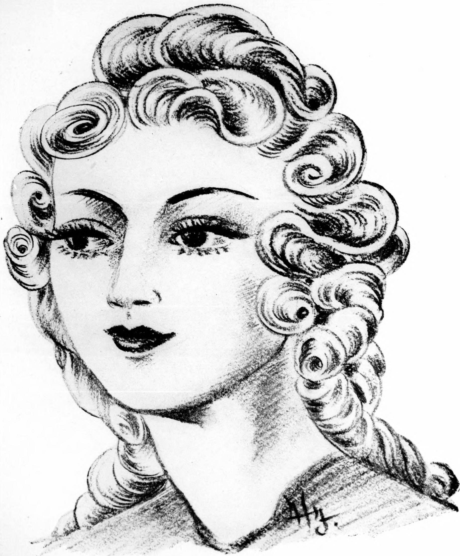
Lokni-frizura fiatal lányok részére