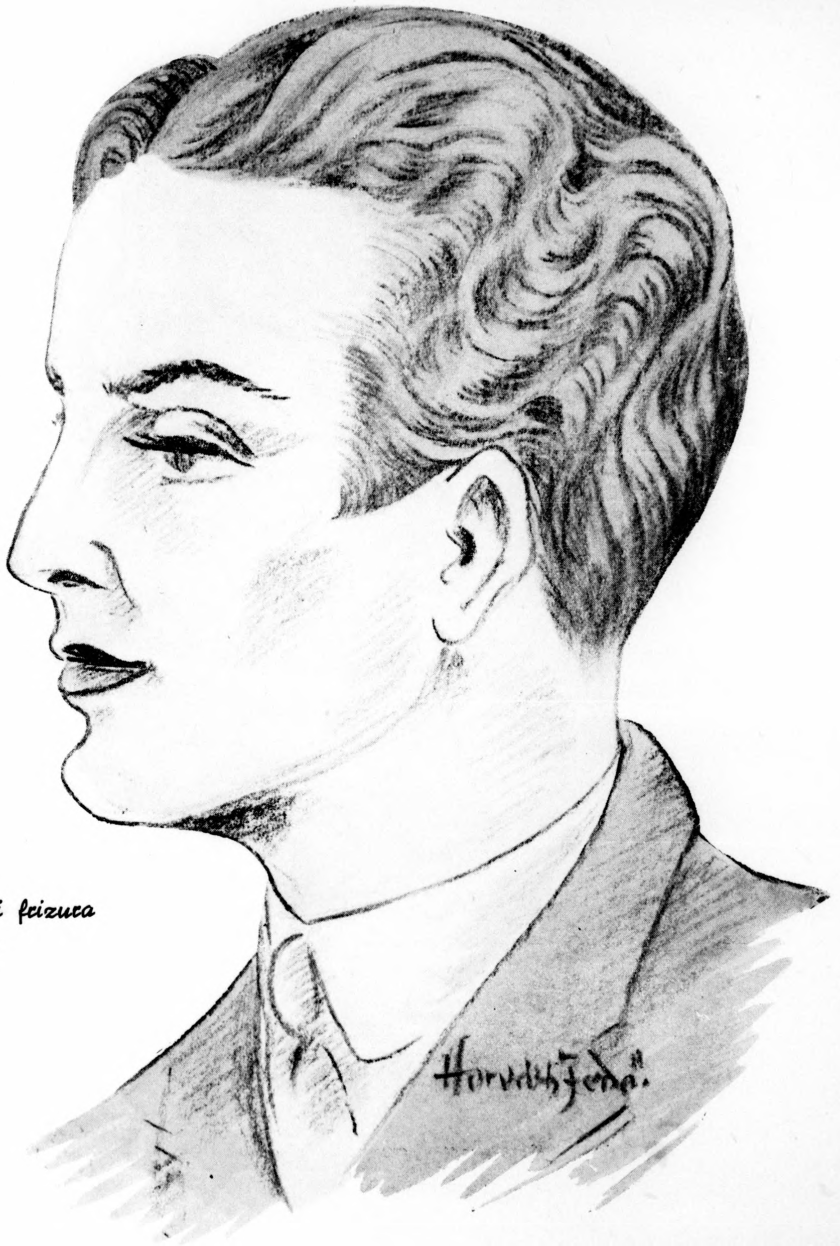
Modern férfi fizuca és hajvágás