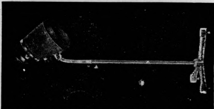
II. számú szárító BURA

Budapest, XII., Böszörményi-út 17/b. Telefon 351-691