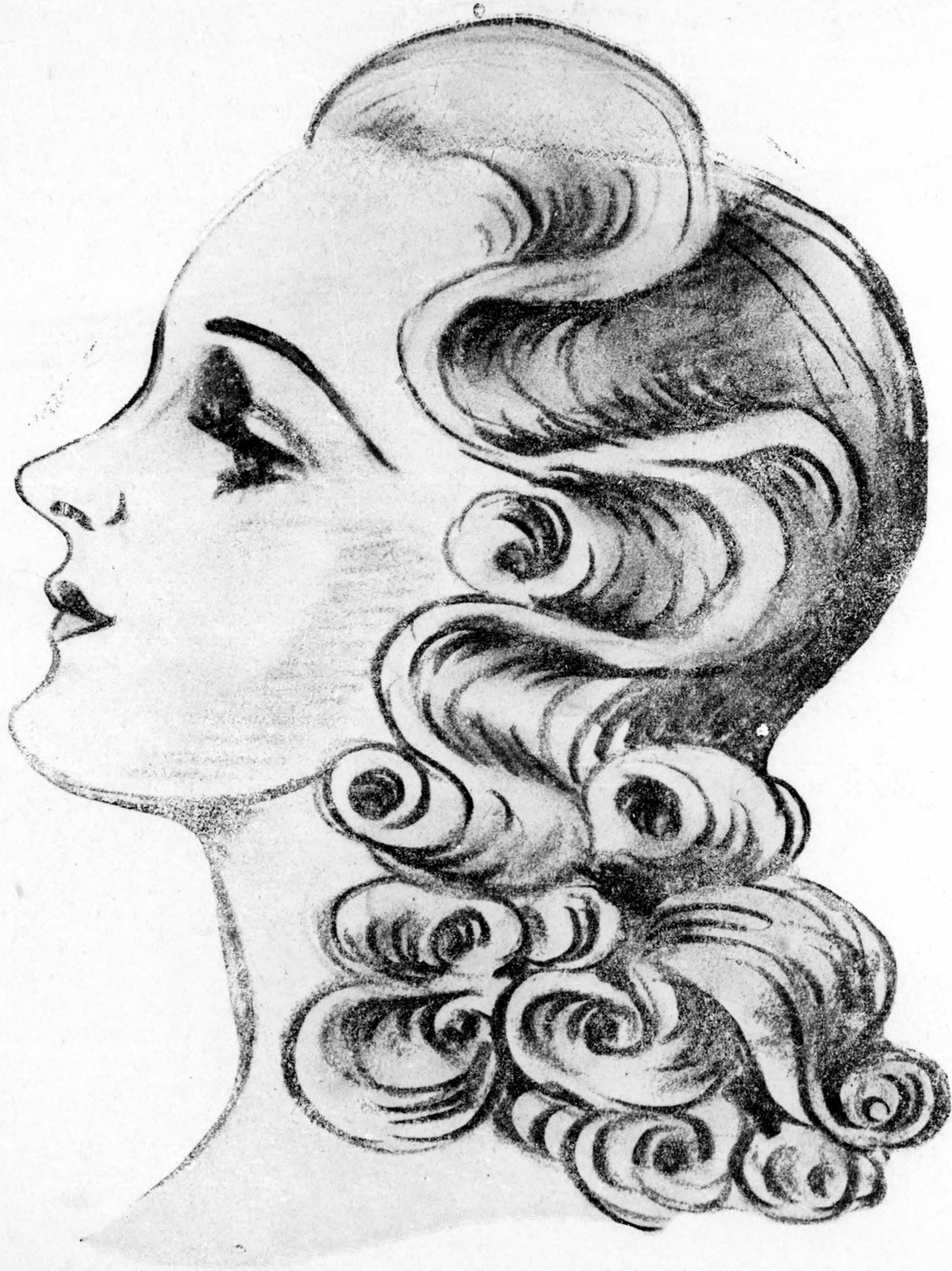
Modern őszi külföldi forma