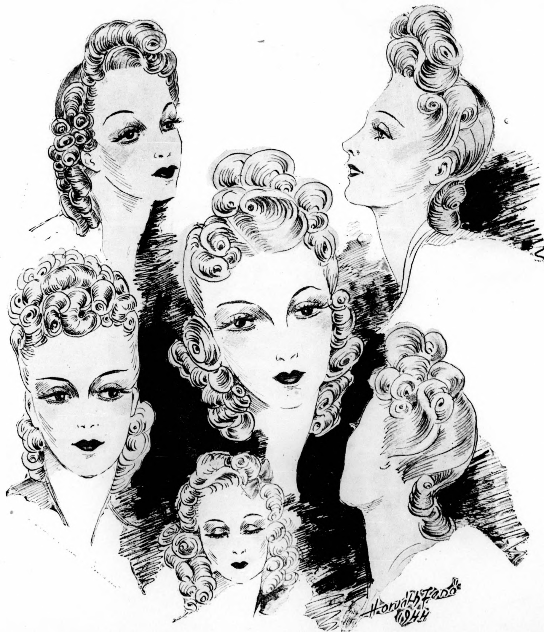
Modern őszi divatfeizura formák