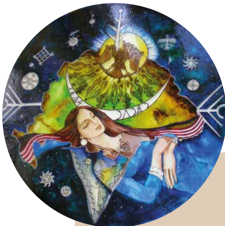
Emese álma – Dávid Júlia üvegfestménye