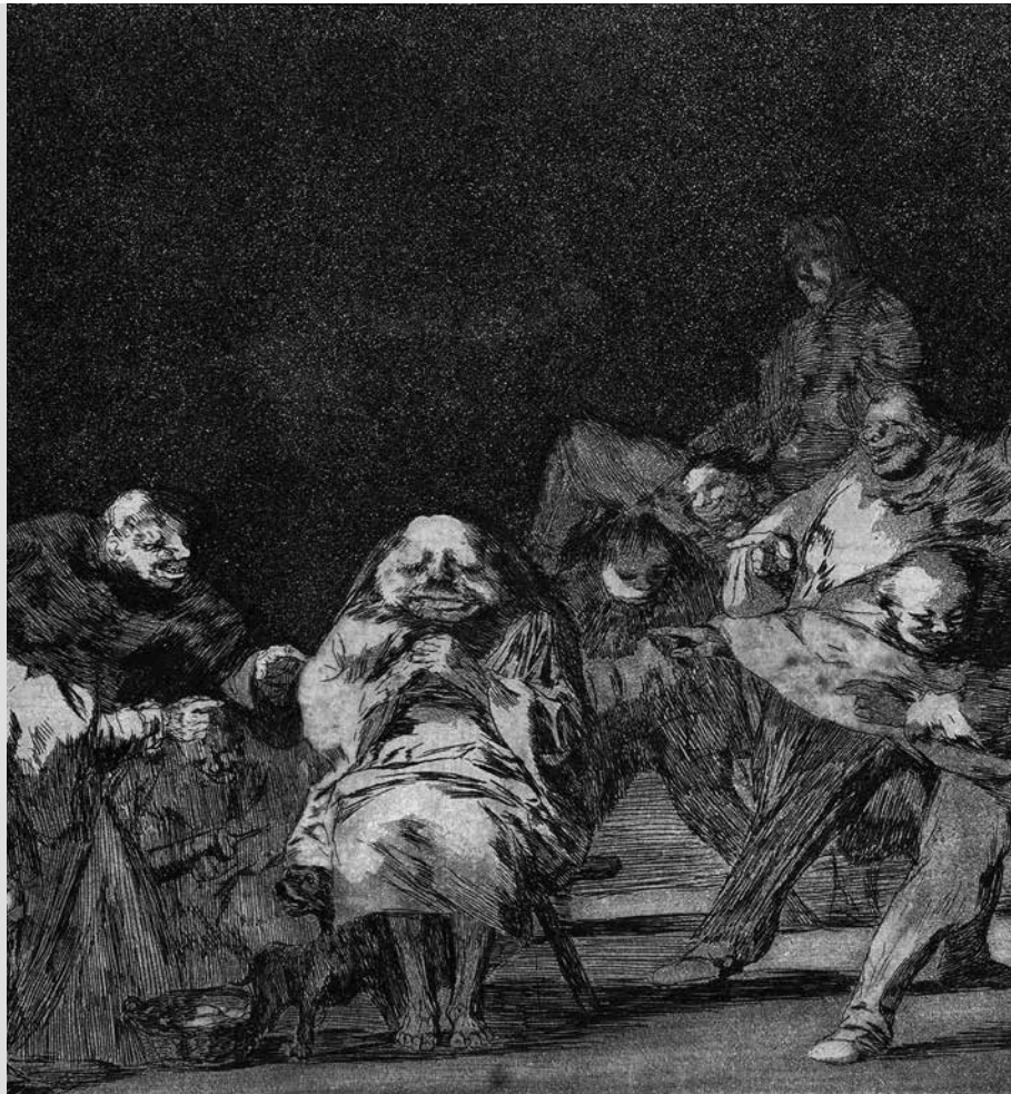
Francisco Goya grafikája

Kerek egész a kő a jégbe zárt anyag tűzbe égett molekula örök a fagy ős-hidrogén alkotta mutáció véletlen változás lét-molekula ítéletet hirdet első stáció elektron-kacsokkal fojt pokol ura kristályba fagyott halál erenes-anyag élősködik bennünk a kapzsi láncolat mely hajt és morzsol akár kemény követ hitetlen sejtjeinkbe falja magát a bölcsesség elhal feleselsz öreg időd lejár babona-spirál achát ha megszólal benned a teremő tudat magadban véled keresed a tévutat ha kénsárgán elpárolog a lélek kevély tested mint földköpeny törékeny melyen áthalad a teremő lényeg gőgjében gúnyolódik az igéken a kövek szépsége e parányi tökély túlél az érc vak szolgálószton ösztökél nem észleled hogy hit a szerves léted a rend a véletlen sejt fölémelt alkotni szólni rendelt az élet a múlandó köt meg amikor letelt táncol az élet határán a véletlen szólít az úr de benned kő és jég terem