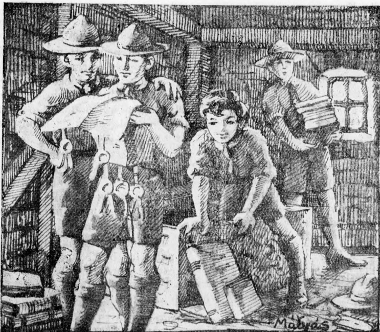
Szabályszerű adománylevél volt