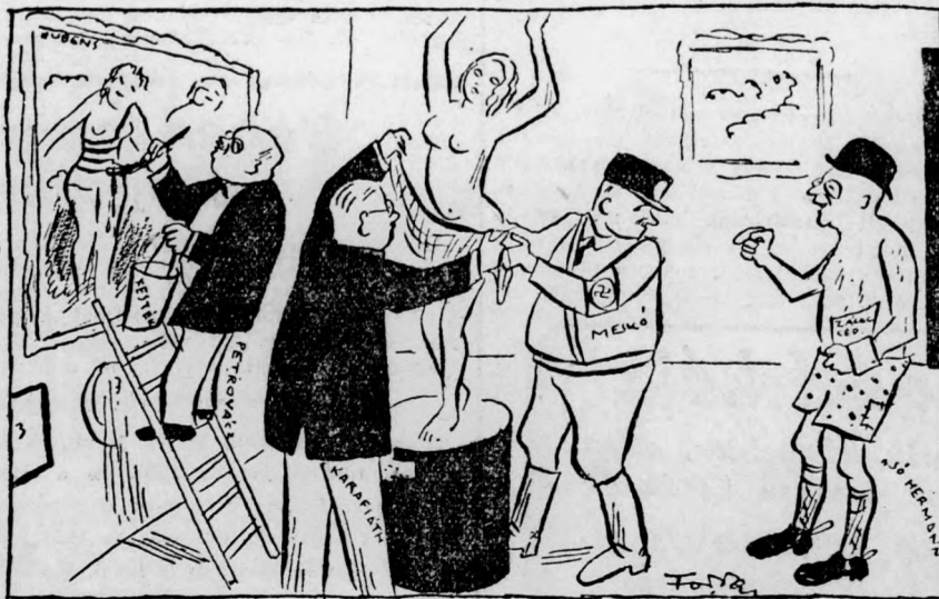
„SÓ HERMANN”: Kedves uraim, látom, hogy nagyon öltöztetb kedvükben vannak... Nem öltöztetnének fel engem is valami divatos nyári ruhába?... Nem