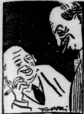
STUX ÉS FUX BESZÉLGÉSE a 8. oldalon