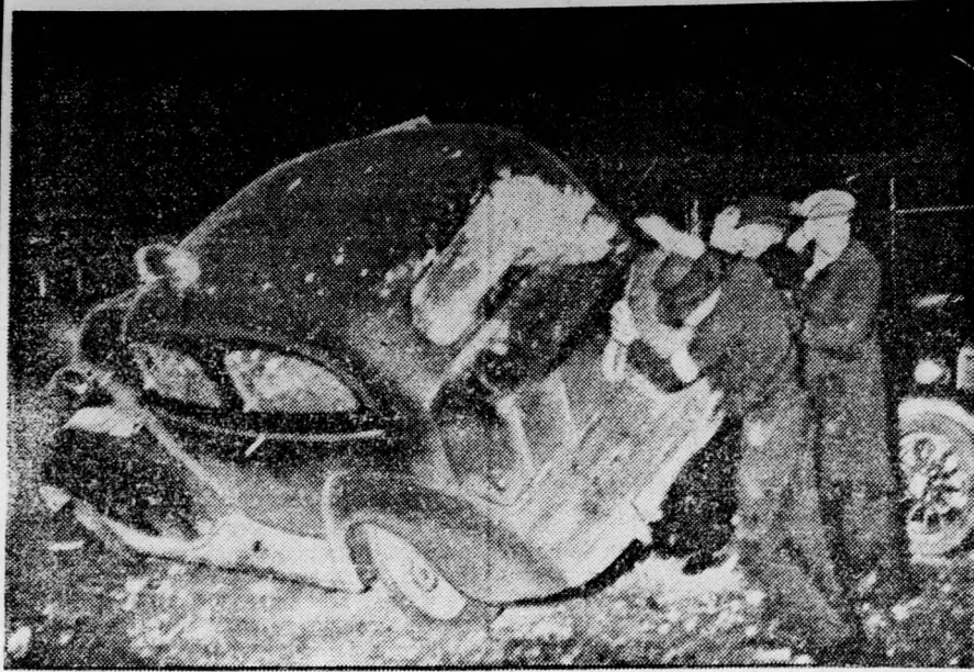
A sztrájkoló amerikai autógyári munkások a Michigan-állambeli Flintben felborítják a kocsikat,

Munkabéremelést és fizetési szabadságot kapnak az ózdi munkások. Miskolcra telefonálja a Magyar Hétfő tudósítója: Az ózdi vasgyár vezetősége a kapukra kifüggesztett hirdetőnyelben közölte a munkásokkal, hogy január 1-ig visszamenőleg felemeli bérüket és bevezeti a fizetési szabadság rendszerét. Ez azt jelenti, hogy a multtal ellentétben, a munkások szabadságuk tartalma alatt is megkapják bérüket. A béremelés összegét még nem közölték, ez csak február 1-én kerül nyilvánosságra.