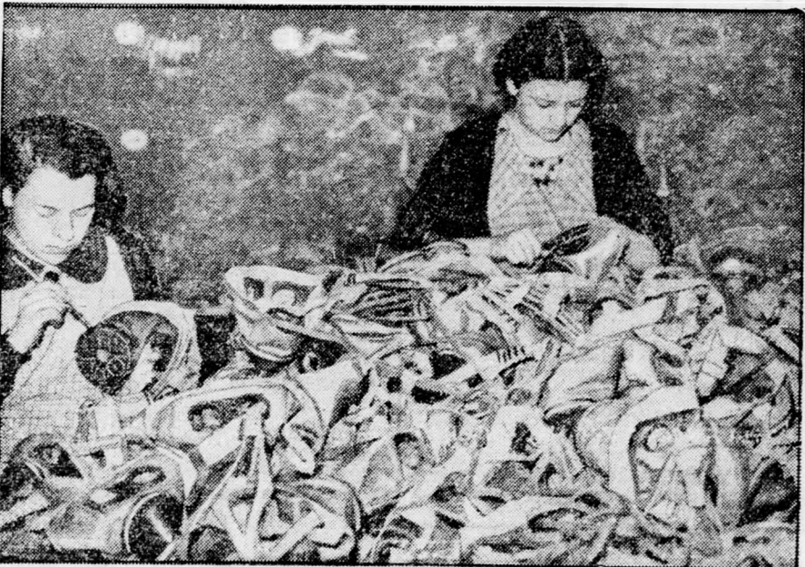
Páris város képviselőtestülete elhatározta, hogy a francia főváros minden lakosát gázálarcra látja el. A gázálarcok tömeges gyártását már megkezdték.