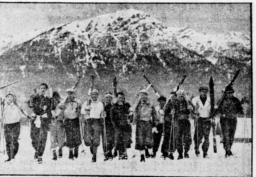
A Garmisch-Partenkirchenben rendezett téli sporthét osztrák résztvevőinek csoportja.

Ezer új teherautót indítottak útnak Barcelona felé. Párisból jelentik: Egyes lapjelentések szerint Párisból délre, Bourg-la-Reine-nél, a Dél-Franciaországba vivő országúton ismét hadianyaggal, élelmiszerekkel és ruházati cikkekkkel megrakott két tehergépkocsit foglaltak le; a kocsik Spanyolországba igyekeztek. A kocsivezetőket letartóztatták. Az „Echo de Paris” közli, hogy az egyik montreuili gyárból a legutóbbi négy-öt hónap alatt több mint ezer teljesen új tehergépkocsit indítottak útnak Barcelonába, a kocsikat különféle árukkal rakták meg, valószínűleg hadianyaggal is. A lap a továbbiakban azt a kérdést intézi a külügyminiszterhez, van-e tudomása arról, hogy naponta többszáz hadianyaggal megrakott teherkocsi halad át a marseillei pályaudvaron és hogy az arenci kikötői pályaudvaron jelenleg is hadianyagot szállító harminchétfő vonat van?