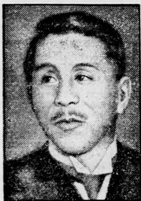
Hirota, a lemondott japán miniszterelnök.