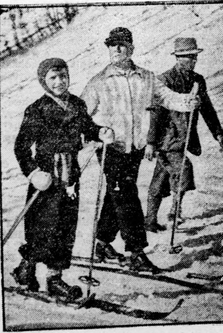
Mussolini, fiával Romanoval síel Róma közelében.