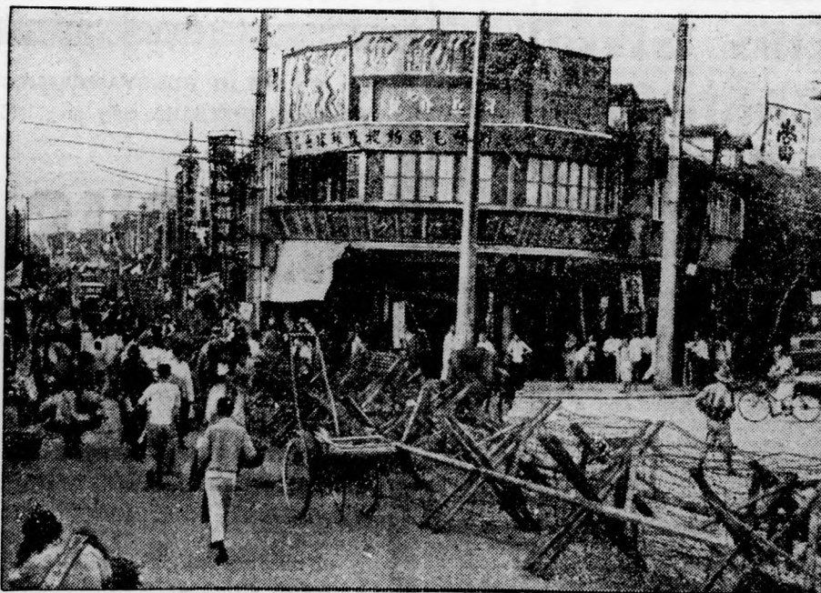
Drótkadályok választják el Sangháj kínai negyedét a nemzetközi francia engedélyes területtől