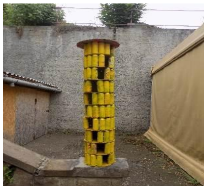
3. kép. Madárház.

- A tárgyak bemutatása prezentáció formájában a csoport tagjai előtt, komplex önreflexió a teljes munkafolyamat figyelembevételével a tervek, prekonceptiók és kész tárgyak, kihívások, megoldott és megoldatlan problémák viszonylatában. Kapcsolatfelvétel a témában autentikus helyi szervezetekkel, intézményekkel a madárházak végleges elhelyezését illetően. Együttműködés a helyi madártani szövetkezettel, a madárházak elszállítása az Eszterházy Károly Egyetem Természettudományos Tanszékére, majd onnan a kijelölt befogadó intézményekhez történő végleges kihelyezése (óvodák, iskolák) (3.kép).