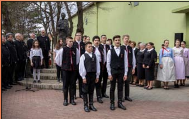
A szavalók – Dicsőséges nagyurak...