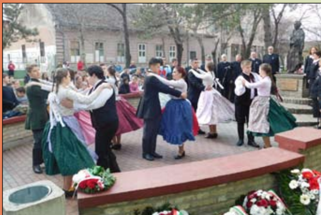
A néptáncosok és a lelkes közönség