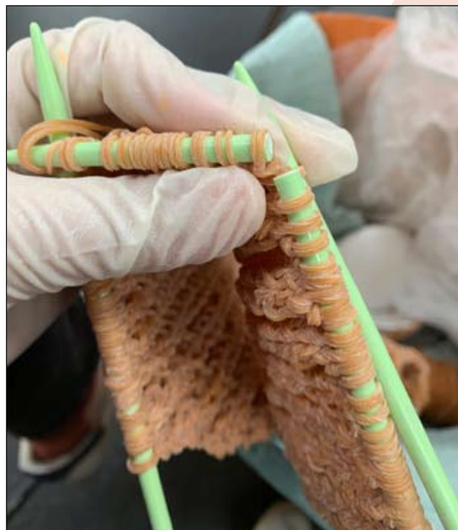
A Rin Szakamoto által tervezett ruházat, amely teljes egészében kötött a gumiszalagból készült

Első pillantásra ezek a ruhák úgy néznek ki, mintha hagyományosan gyapjúból vagy fonálból készítették volna őket. Közélebről megvizsgálva azonban láthatóvá válik, hogy elasztikus, gumyszerű anyagból készültek.