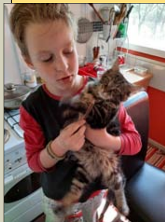
Tot Hunor: Manócska cica írni tanul