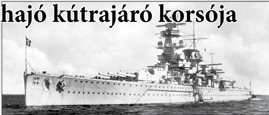
Itt még büszkén feszít az Admiral Graf Spee

Október 5-én a kukoricát szállító Newton Beech teherhajóra csapott le, két nappal később a brit Ashlea-t küldte a