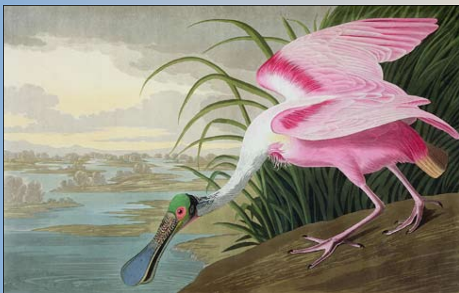
John James Audubon: Rózsás kanalasgém (1836)

A tengerész, aki kitanulta az állatpreparálás fortélyait, sokat utazott, figyelte az állatokat és emellett festett is, így megjelenítette Amerika minden madárfaját. A Birds of America (Amerika madarai) című könyv ma a világ legdrágább tíz könyve között szerepel.