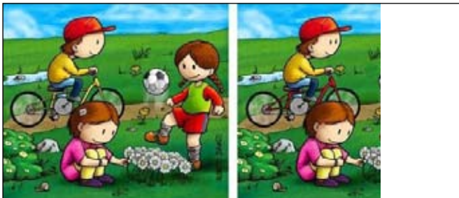
Aki szemfüles, 7 különbséget talál a két kép között!