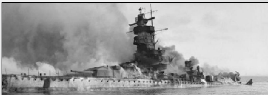
Lángokban a süllyedő kalózhajó