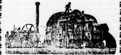
Műlakatosi műhelyemet egy

Gazdáknak, malom- és géptulajdonosoknak fontos!