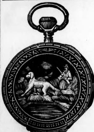
Ezüst-horgony remontoir órák öt évi jótállással 14 forintig.