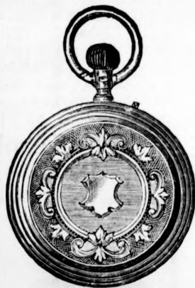
Százféle kivitelű csinos tula-órák kitűnő szerkezettel 18—35 forintig.