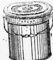
Szoba-klozet vödör alakban.

As egyedüli gyártási jogot bírja: ZELLERIN MÁTYÁS cs. és kir. udv. szállító Budapestben, nagydófa-utca 14. sz. alatt. Képes árjegyzékek bérmenten küldetnek. Elárulások kerestetnek.