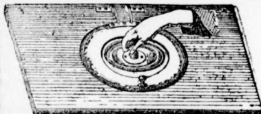
Ütődessza klozet és nyílt árnyékszékek részere.