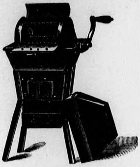
John-féle telített gőzmosógép, mellyel a megtakarítás idő, pénz és anyagban 75%