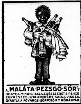
A. MALÁTA-PEZSGŐ-SÖR HOGYHA MINDIG IZZA, EGÉSZSÉGET S PÉNZT EGYRÉSZELET JUTALOMMÉRT KÁRJÁ VISSZA GYÁRTJA A FŐVÁROSI SÖRPIZÓ R.T. KÖBÁNYÁN

SZALLODÁK, VENDEGLŐK, KÁVÉHAZÁK KÖZVETÍTÉSÉT MINDENNEMŐ ÜZLETKEZÉS ADÁS-VÉTELÉT BIZTOS EREDELMÉNYTEL ESZKÖZLI VENDEGLŐSÖK KÁVÉESOK ADÁS-VÉTELI FŐIRODÁJA: BUDAPEST, VII., SZÓVETSÉG- UTCA 12. TELEFON: J. 149-04