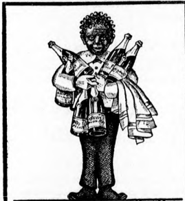
A MALÁTA-PEZSGŐ-SÖR! HOGYHA MINDIG ISSZA EGÉSZSÉGÉT S PÉNZE GYRÉSZÉT JUTALOMKÉNT KAPJA VISSZA. ÉGYRTÁJA A FŐVÁROSI SÖRÖZŐ RT. KÖBÁNYAR.