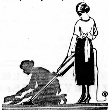
A takarítás hajdan és most!

Ügyeljük a címre és a telefonszámmal Óvakodjunk külsőleg hasonló utánzatoktól! Érdeklődésnél sziveskedjék lapunkra bivatkozni.