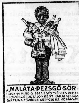
A. MALÁTA-PEZSGÓ-SÖR T. HOGYHA MINDIG ISSZA KEGYÉSZÍTÉS PÉNZE EGYRÉSZEZT JUTALOMKÉNT KAPJA VISSZA GYÁRTJA A FŐVÁROSI SÖRFŐZŐ RT. KÖSBANÁN.