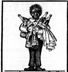
A. MALÁTA-PEZSGŐ-SÓR HOGYHA MINDIG ISSZA EGÉSZSÉGÉT S PÉNZÉ EGYSZERÉT JUTALOMKÉNT KARJA VISSZA GYÁRTAJA A FŐVÁROSI SÓRŐZŐ RT. KÖBÁNYÁN.

Szállodai és éttermi fehérneműek: Asztalneműek kerti arbeszok, len- és pamutvásznak, törülközők eredeti gyári árakon