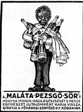
A. MALÁTA-PEZSGÓ-SÖR HOGYHA MINDIG ISZALJA EGÉSZSÉGÉT S PENZE EGYRÉSÉRE JUTTATKONYMÉNT KAPJA VISSZA GYÁRTJA A FŐVÁROSI SÖRFOZÓ R.T. KÖBÁNÁR

M. kir. állami rendőrség győri kapitánysága. 200/6. kih. 1927.