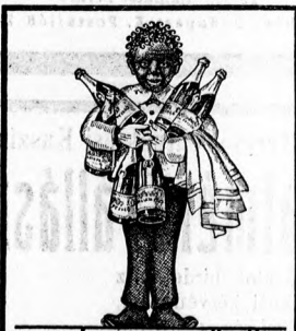
A. MALÁTA-PEZSGŐ-SÖR HOGYHA MINDIG ISSZA, EGÉSZSÉGET S PÉNYE EGYRE SZÉTELT, JUTALÉKOK, ANTIKOK, SZÖKÖK JÁRTÁNYON ÁRBAN KÖLTSÉGEN KAPHATÓK.