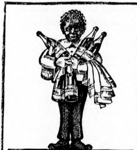
A MALÁTA-PEZSGÓ-SÖR! HOGYHA MINDIG IZZA EGÉSZSÉGETS DENEZ EGYRÉSZÉT JUTALOMKÉNT KAPJA VISSZA GYÁRTJA A FŐVÁROSI SÖRFŐZŐ R.T. KÖBÁNYÁN