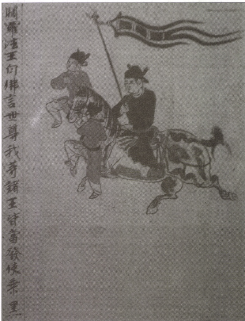
HÍRNÖK. BUDDHISTA KÉZIRAT ILLUSZTRÁCIÓJA A 10. SZÁZADBÓL; TUS ÉS SZÍNEK PAPÍRON