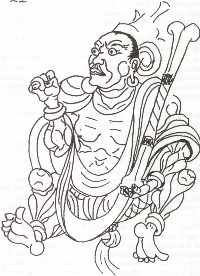
FALFESTMÉNY RÉSZLETE TUNHUANGBÓL A SZERZŐ TOLLRAJZA, 1953