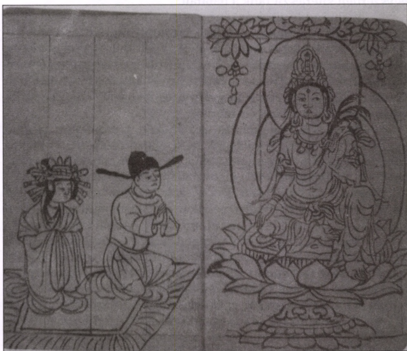
KUAN-YIN ÉS A HÍVŐK. TUSRAJZ PAPÍRON, 10. SZÁZAD