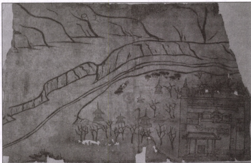
KOLOSZTOR (TUNHUANG?) PAPÍR, TUS SZÍNEKKEL, TIBETI ÍRÁS. 9. SZÁZAD