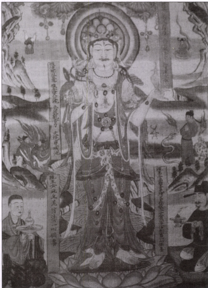
KUAN-YIN BÓDHISZATTVA, A MEGMENTŐ. SELYEM-FESTMÉNY, 10. SZÁZAD