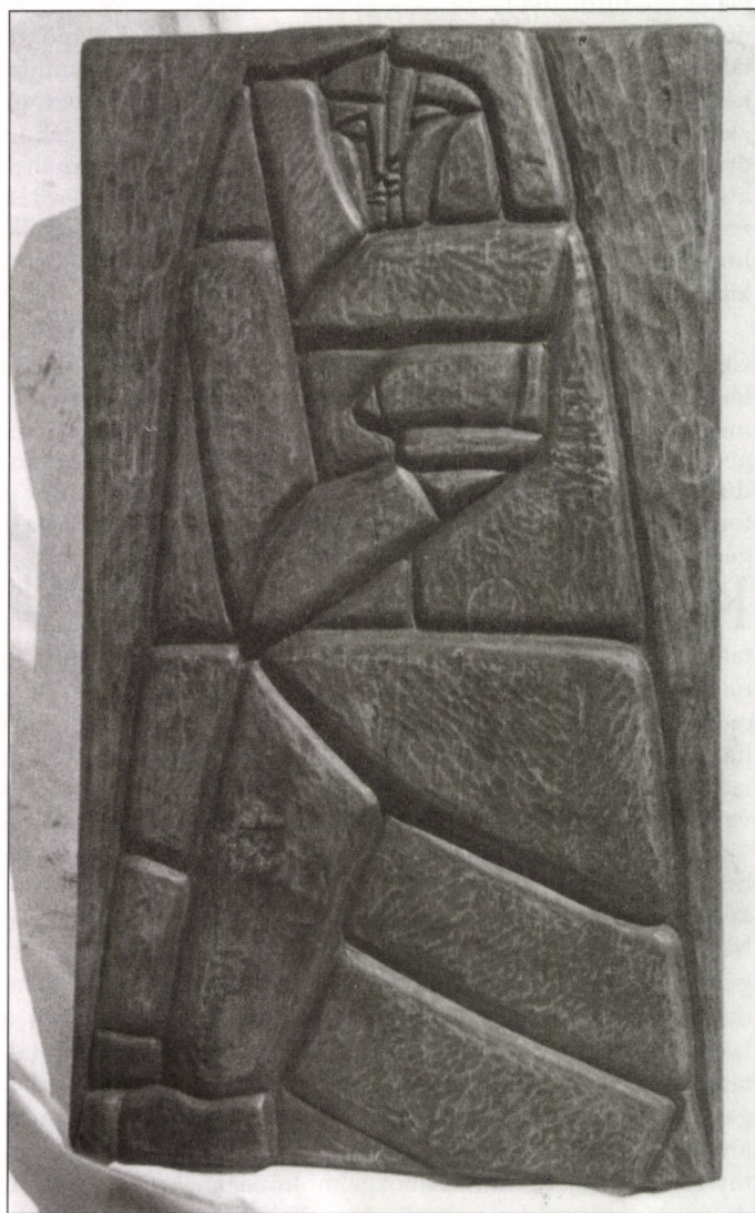
LIPCSEY GYÖRGY: SZERELEM II.