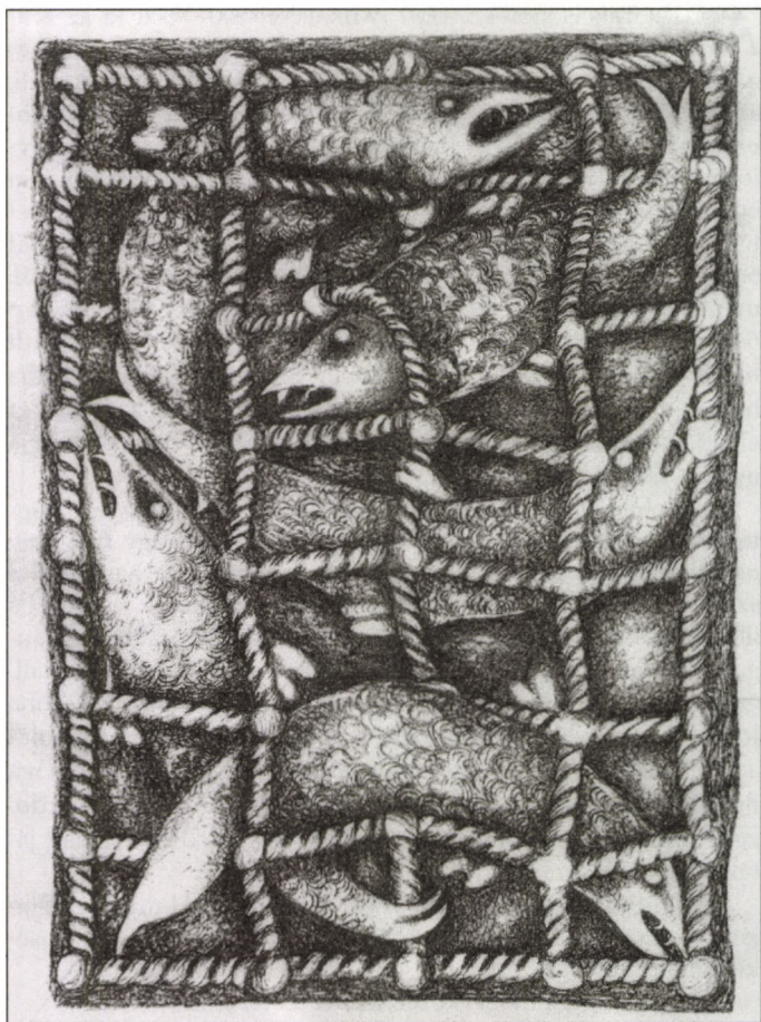
LIPCSEY GYÖRGY RAJZA