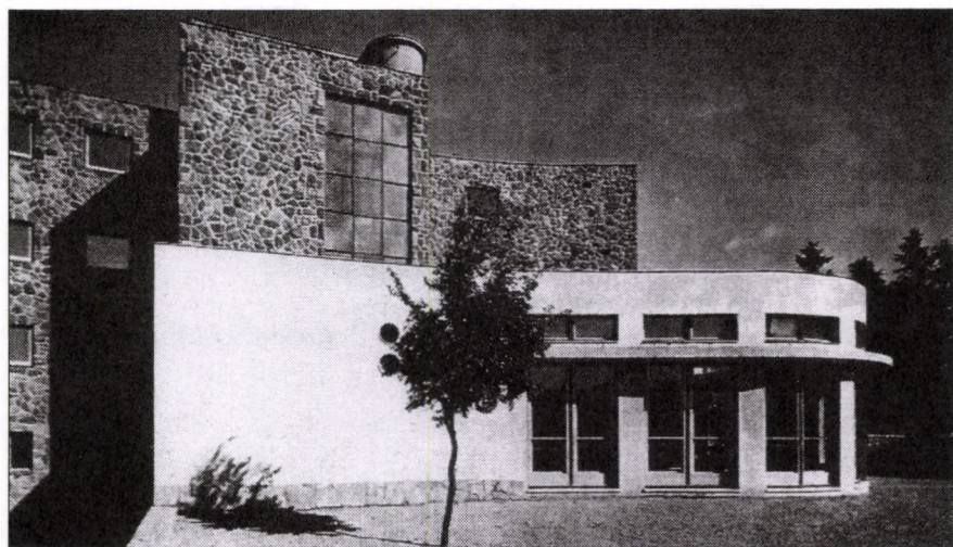
A HAJDANI GYOPÁR-SZÁLLÓ HOMLOKZATAI, SZÉCHENYI-HEGY Fischer József, 1942