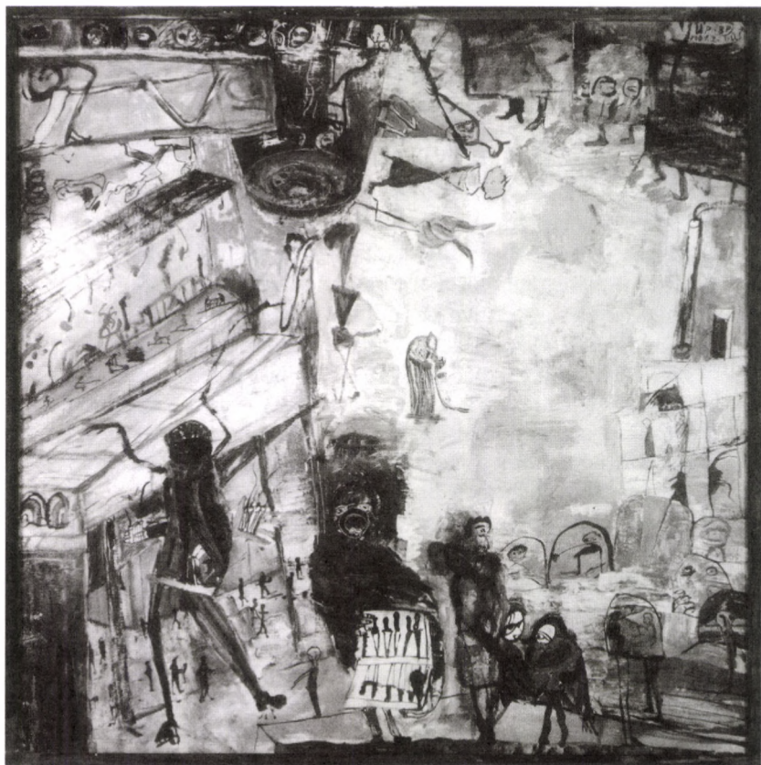
ÖRS VEZÉR TÉR (RÉSZLET) II., 2000