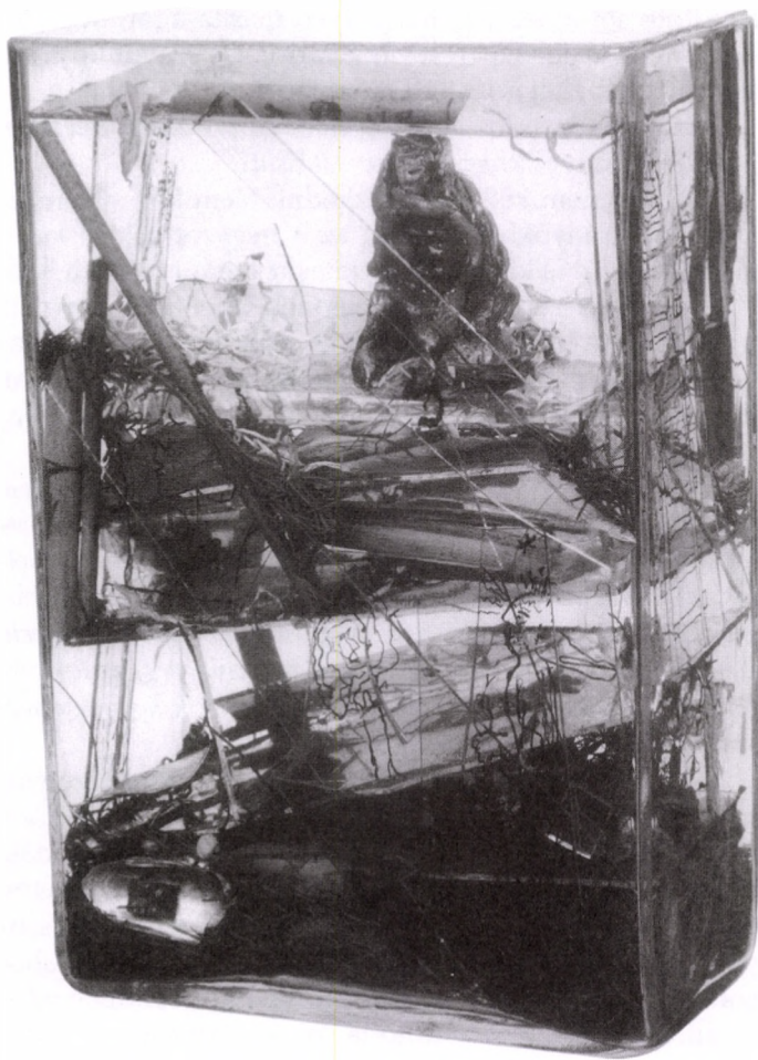
TERMÉSZETEM II., 2000 vegyes technika, üveg, 33×21×12 cm