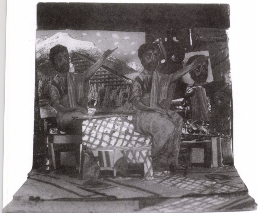
„VOLT SZLOVÁK KOCSMAKÉP” 1988 papír, vegyes technika, 19×22×19 cm

ség) és minőségi (megfelelő kulturális szint és képesség) szempontjai.