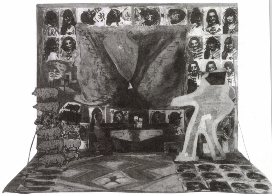
„ÉRETTSÉGI TABLÓ” 1991 papír, gipsz, vegyes technika, 50×70×50 cm

1940. október 3-án a románok felmondták a kisan- tant szerződést, ezzel megnyílt a lehetőség a magyar-ju- goszláv közeledés előtt. Szegény Telekinek, miután sorra kiestek az „ellensúly” potenciális részei, csupán Jugoszlá- via maradt. Német helyesléssel, tehát náci érdekeket is szolgálva, jött létre a baráti szerződés, melynek szerb vélemény szerint is az volt a célja, hogy határozottab- ban tudjanak ellenállni Németországnak. Az „örök” jel- zőt gúnyosan szokták hangsúlyozni történéseink (már- mint a marxisták), pedig tudható, jugoszláv javaslatra került be a szerződésbe ez a szó, mert a jugoszláv-bolgár paktumban is szerepelt.