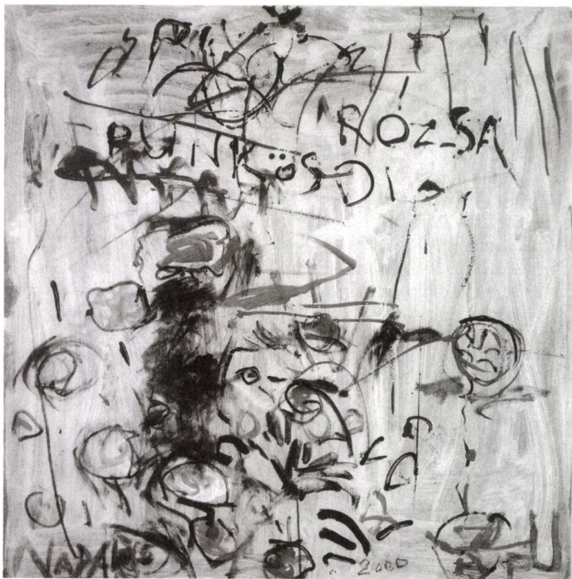
NADAPI KERT – PÜNKSÖSDI RÓZSA, 2000 akril, farost, 199100×100 cm

nagyon is hajlamos volt a tépelődésekre, de ha biztos volt a dolgában, akkor tudott gyorsan és energikusan cselekedni. Bárdossy Lászlót régóta ismerte, tudta, hogy az ő fogalmai szerint jó magyar ember. Sok jót hallott műveltségéről, briliáns észjárásáról. A londoni tanácsosi évek szintén kedvezően nyomtak a latban, a bukaresti követi tevékeny-