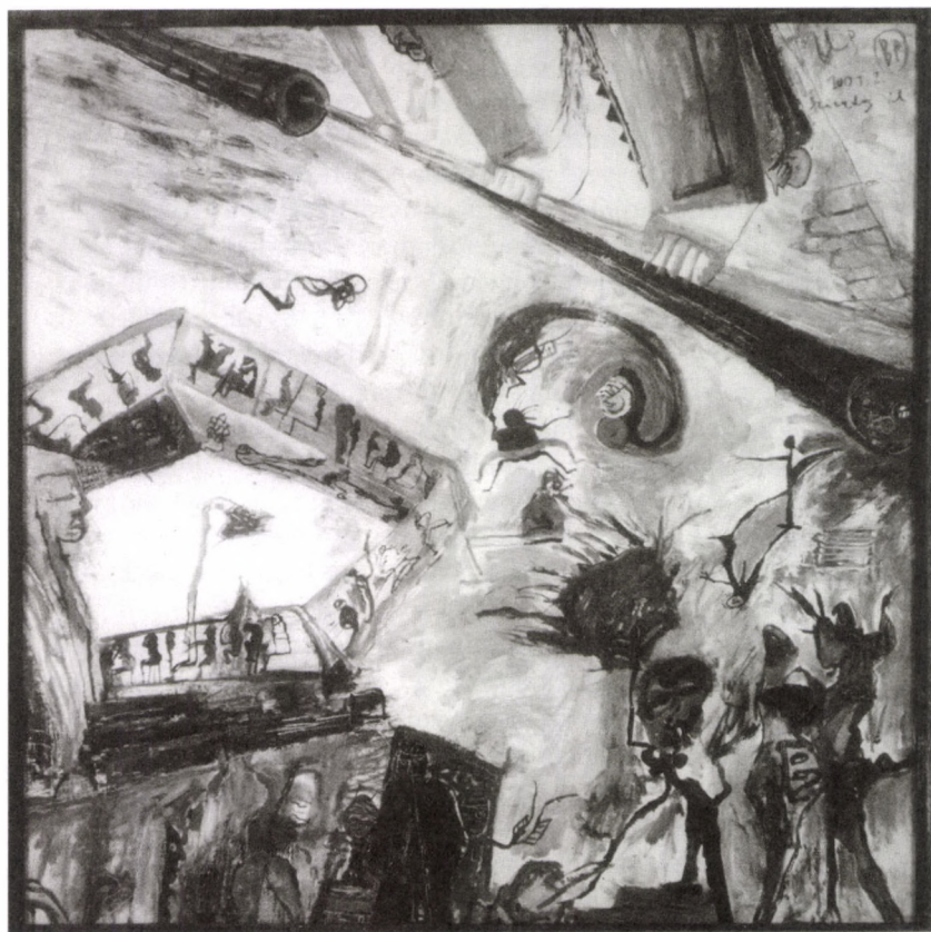
ÖRS VEZÉR TÉR (RÉSZLET) IV., 2000 akril, farost, 100×100 cm

Van egy orosz közmondás, amelyet Lengyel József egyik naplójában olvastam: „Mit toll megírt, fejsze ki nem irt”. Csak az marad meg, amit megírtak. Amit nem írtak meg, az elvesz, bármilyen csodálatos módon volt is elképzelve – az marad meg, amit megírtak.