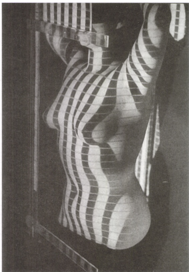
A négyzethálóval megvilágított felsőttest a kilgész állapotában (a mérés során készült dokumentumfotó)