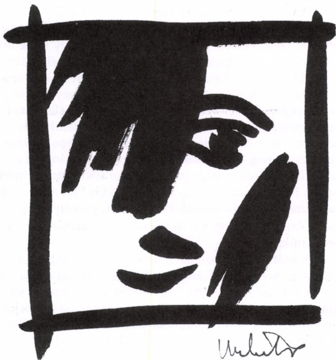
KECSKEMÉTI KÁLMÁN: CÍM NÉLKÜL

gatra fekszik. „Közel a Duna és a Dráva folyó szögletéhez, a Drávához tizennégy kilométerre.” A lexikon szerint a századfordulón mintegy 600 lakosa volt, az állandó fogyás következtében 1990-ben már csak 260-an lakták. A legtöbbször katolikusok vagy reformátusok. A volt miniszterelnök családja is református volt. Az 1903-as évben Magyarországon sorozatosan törtek ki sztrájkok. Nagy Ferenc születése előtti napon éppen befejeződött 1400 pécsi építőmunkás szeptember 26-án, béremelésért indított kéthetes sztrájkja, amelyhez közben a város csaknem valamennyi munkása