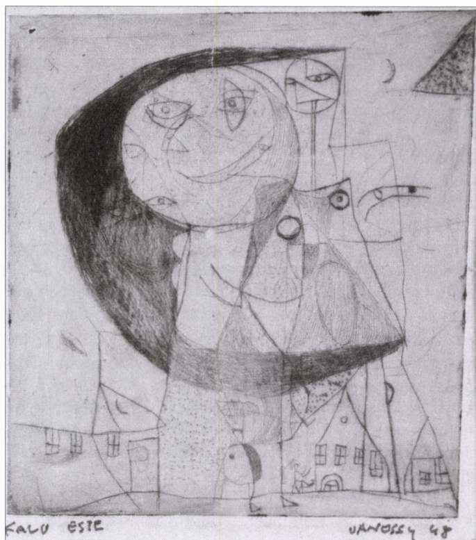
FALU ESTE, 1948 hidegtű metszet, 12,5×11,5

ráns baloldali politikusok is az 1937. évi csehszlovákiai országhatárok helyreállítását tűzték ki célul; míg a konzervatív, keresztény, nemzeti, sőt szélsőjobboldali eszmei áramlatokat egyaránt magába olvasztó önálló Szlovák Állam vezetői és támogatói átmenetileg elfelejtkeztek a csehszlovák összetartozás élményéről, a bécsi döntés számukra okozott területi veszteségeit azonban mindenképpen jóvá akarták írni.