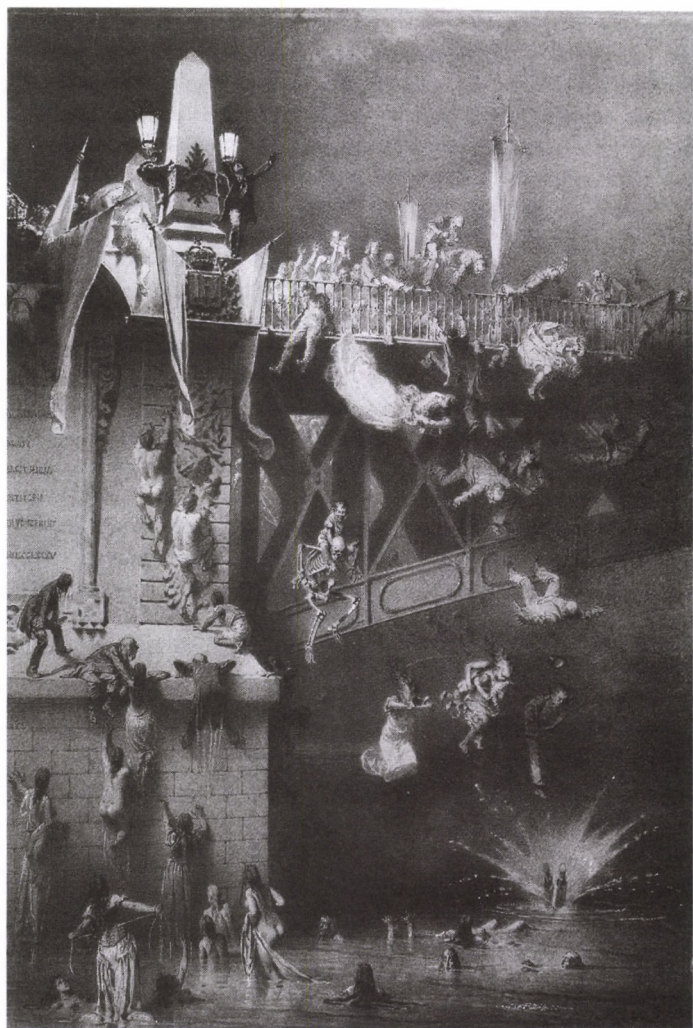
ILLUSZTRÁCIÓ ARANY JÁNOS HÍDAVATÁS CÍMŰ MŰVÉHEZ Ceruza, papír, 1892