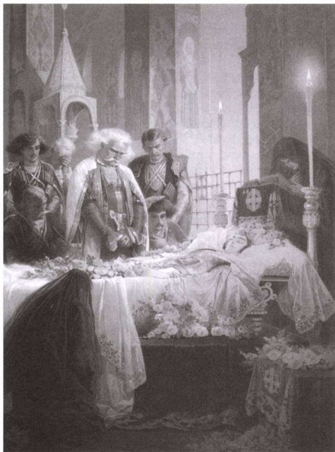
ILLUSZTRÁCIÓ LERMONTOV „DÉMON” CÍMŰ MŰVÉHEZ: TAMARA A RAVATALON Színes litográfia, papír, 1880