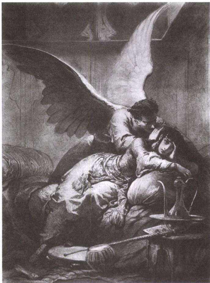
ILLUSZTRÁCIÓ MADÁCH IMRE AZ EMBER TRAGÉDIÁJA CÍMŰ MŰVÉHEZ: A RABSZOLGA HALÁLA