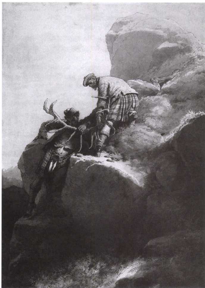
SKÓT VADÁSZJELENET Nyomat, 1878