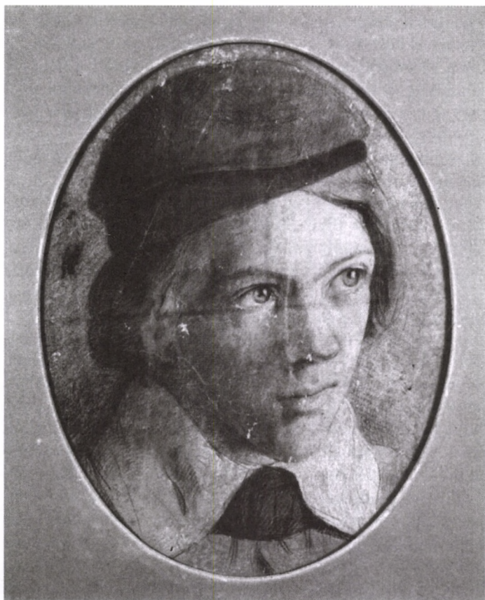
ZICHY MIHÁLY ÖNARCKÉPE 13 ÉVES KORÁBAN Ceruza, papír, 1840