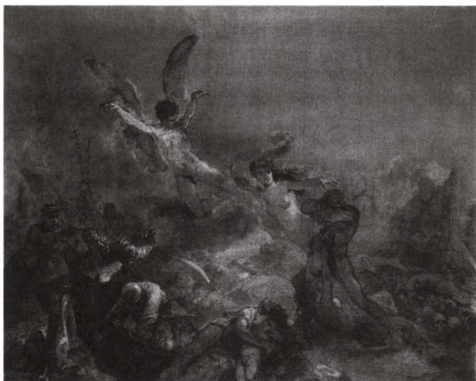
VÁZLAT A ROMBOLÁS GÉNIUSZÁNAK DIADALA CÍMŰ KÉPHEZ Olaj, vászon, 1878

táviratokat tényleg el tudtunk küldeni a postán keresztül. Megpróbáltuk felhívni nagykövetségeinket különböző országokban: prágai, moszkvai, belgrádi követségeinket, de mindebben csak korlátozott sikereket értünk el. Arra nem emlékszem pontosan, hogy ki javasolta, hogy vigyük ki táviratainkat Bécsbe, és onnan adjuk fel. Lehet, hogy maga Barnes volt, az is lehet hogy Clark, végső soron bárki lehetett. Arra nem emlékszem, hogy én ajánlottam volna.