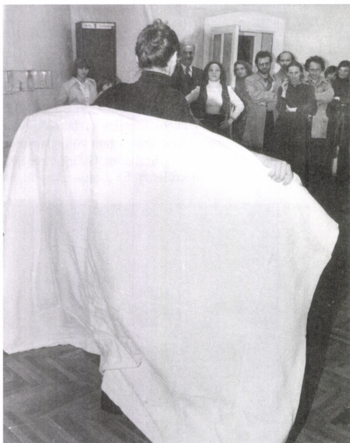
A szüzesség eldobása

nem engedett. A régi Mozgó Világban (1975–1983) sok fotó jelent meg Szabados György munkásságáról, de a lemez más volt. Népzene, kortárs zene, free jazz élt egyszerre és egymásban. Spontán volt és bonyolult, ami nagyon ritka, nem csak a zenében. Vonzódtam az aszimmetrikus ritmusvilághoz, egyre délebbre és egyre keletebbre nyújtottam csápjai-