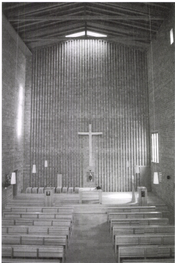
BELSŐ ARCHITEKTÚRA