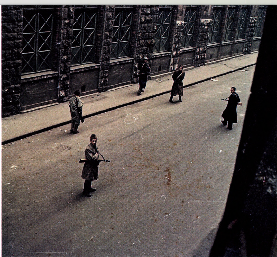
1956 – A forradalom napjai: felkelők a Bródy Sándor utcában

tőinek súlyos aggodalmai vannak, mert a bíboros otthoni és külhoni népszerűségét olyanok használják fel, akik a katolicizmust csupán cégérnek tekintik politikai céljaik eléréséhez. Ezek elsősorban Gömbös- és Szálasi-hívó szélsőjobbaldali körök, és senkinek sem érdeke, hogy a jóhiszemű katolikus tömegek kihasználásával ez előbbiek kerüljenek ismét hatalomra. 14 Tárgyalópartnere, Tardini prelátus „a rendkívüli egyházi ügyek kongregációjának vezetője” reményét fejezte ki, hogy már „jó a viszony a kormány és a bíboros között”, és hozzáfűzte: a magyar katolikusok ne vegyenek részt szélsőséges politikai mozgalomban, nem menjenek se jobbra, se balra, maradjanak középben.