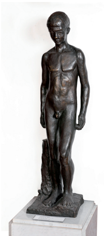
Ferenczy Béni: Álló fiú . (1963, bronz, 137 cm)

Ferenczy Béni másik kedvelt témája, a női akt, szintén jelen volt a balkezes korszakban. A felesége által ihletett erőteljes, izmos nőfigura a mester kiforrott stílusú érett korszakának első éveiben, az 1930-as évek második felében jelent meg, s innentől végig nyomon követhetjük az életműben. Erzsí vaskosan nőies teste, jellegzetes arcvonásai és rövidre