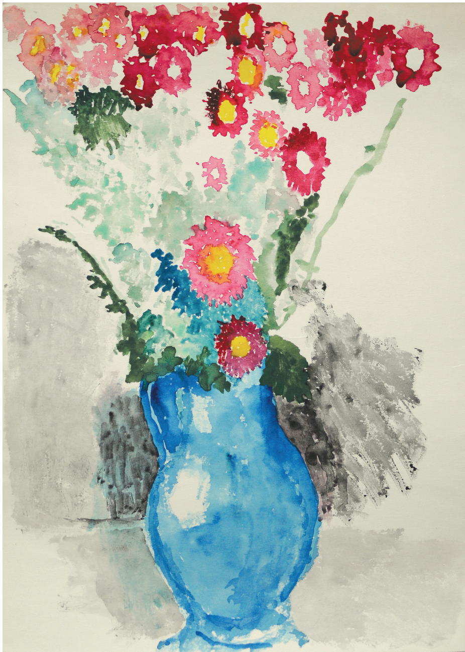
Ferenczy Béni: Színes virágok kék vázában. (Papír, akvarell, 478 × 313 mm, j. n.)