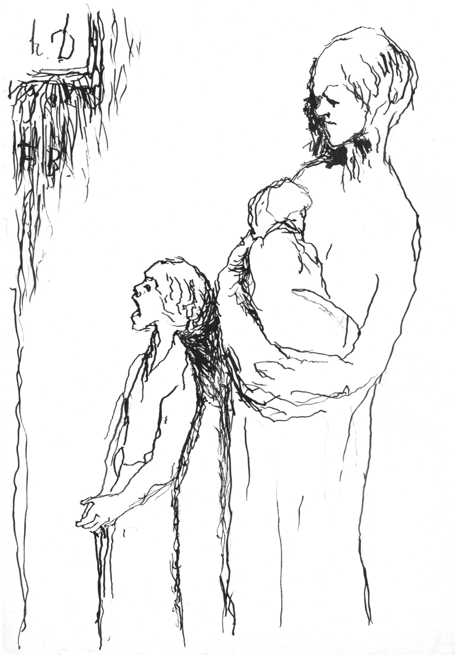
Ferenczy Béni: Kéregető. (Papír, tus, 290 × 197 mm, j. n., felirat b. f.: h. D.), Honoré Daumier azonos című, 1850 körül készült műve (Museum Boijmans van Beuningen, Rotterdam) után