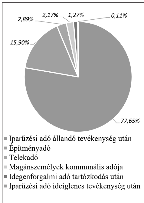
1. ábra: Helyi adóbevételek megoszlása 2012-ben