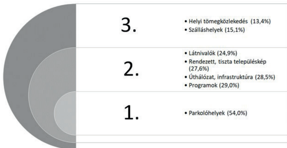
3. ábra: A válaszadók által fontosnak vélt fejlesztési területek