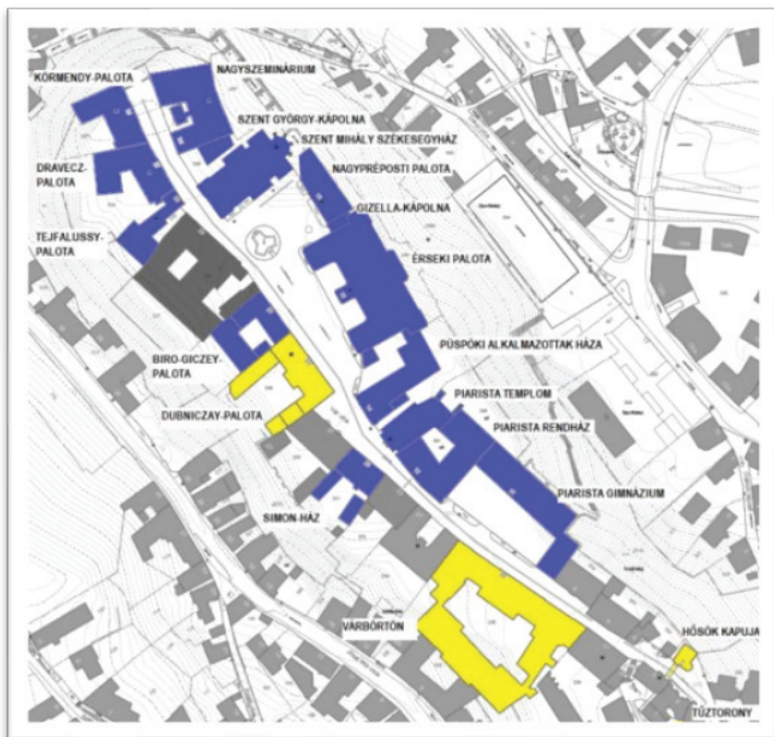
3. kép: A fejlesztési helyszínek (kékekkel jelölt épületek)