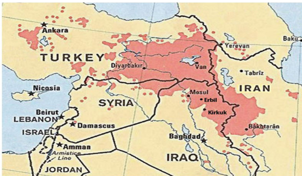
3. ábra: Kurd lakta területek Közel- Keleten