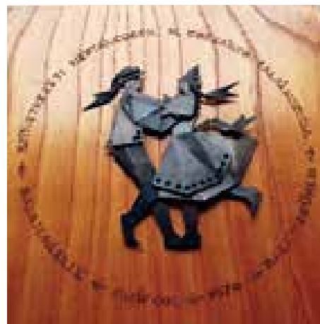
► Szövetkezeti Néptáncosok III. Országos Találkozója plakett, 1970

fizikai munkásként helyezkedhetett el. (Jóval később, 1991-ben megkapta a Magyar Szabadságharcos Világszövetség 1956-os emlékérmét, és forradalmi tevékenységét a Magyar Köztársaságért 1956-os kitüntetéssel ismerték el.)