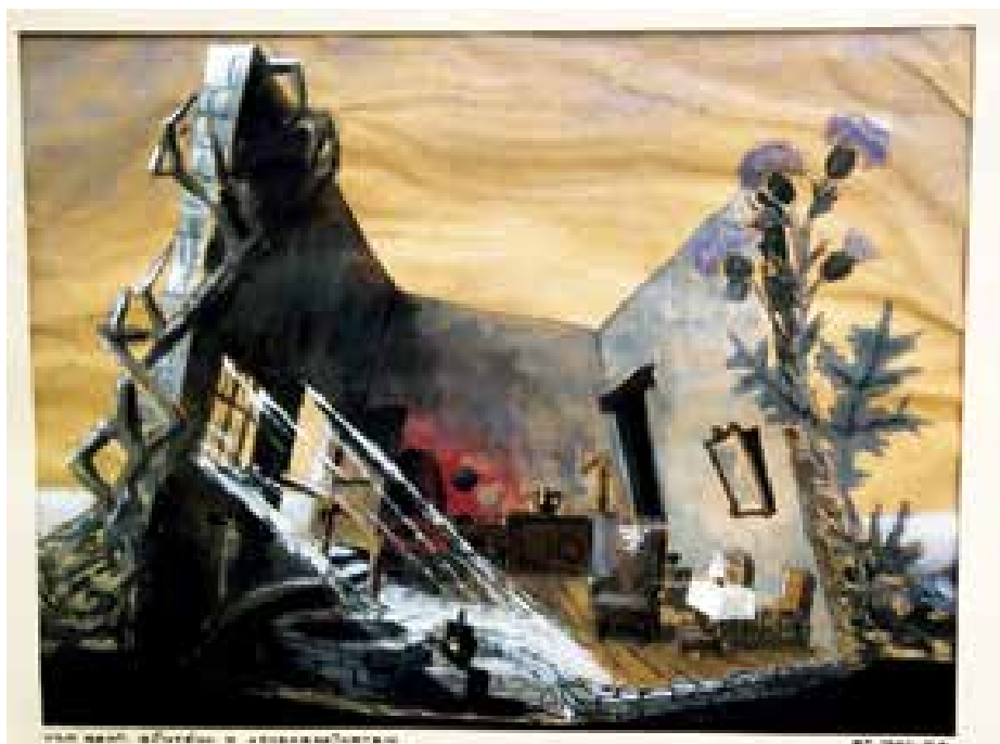
► Ugo Betti: Büntény a Kecskeszigeten

Petőfi Színház következett, ezúttal művészeti titkár beosztásban. Két év múlva már a festőtár és a színház scenikai vezetője lett. Közben elvégezte a Színházi Műszaki Vezetői tanfolyam mindkét szakát. 1978-tól a Budapesti Gyermekszínház scenikai vezetője volt.