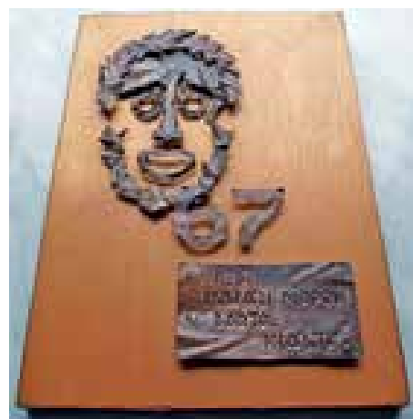
► Füredi Színházi Napok plakett, 1967