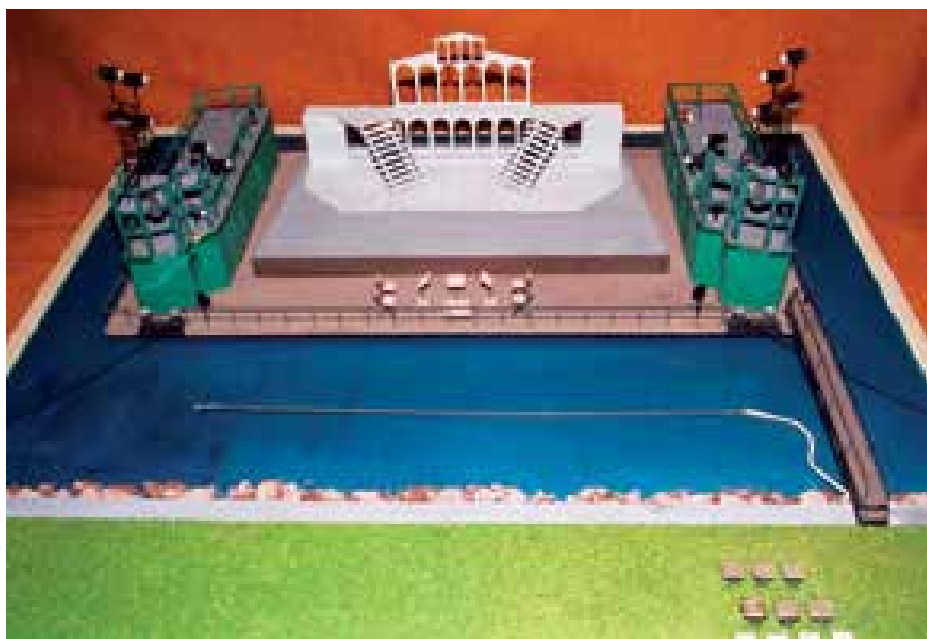
► A balatoni vízi színpad makettje