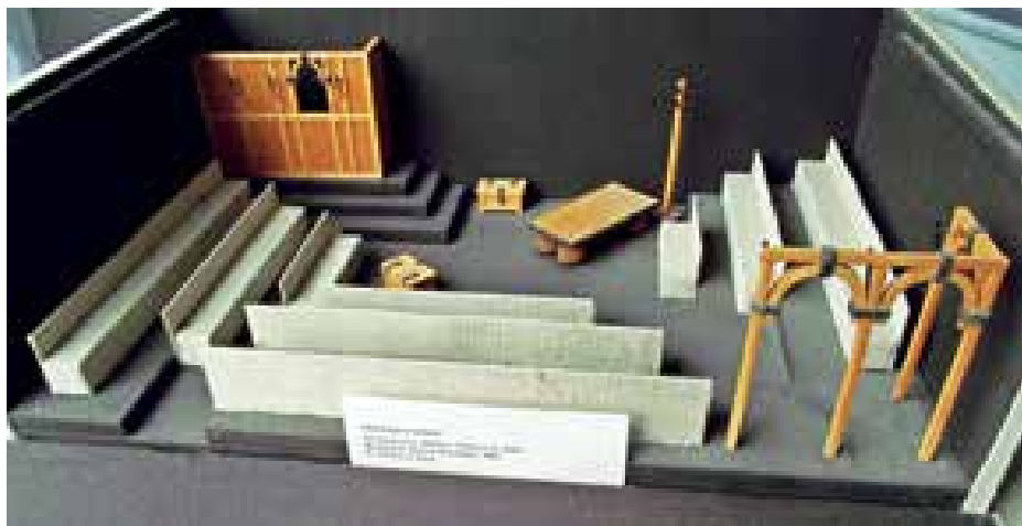
► Rómeó és Júlia, díszletterv makett

1964-ben a veszprémi Városi Művelődési Ház művészeti-módszertani előadója lett, 1968-tól Balatonalmádban moziüzemvezető, majd 1969-ben elvégezte a Pécsi Tanárképző Főiskola népművelő szakát is. 1971-től ismét a